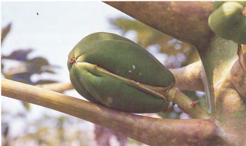
Fruto carpeloide de papaya.

Debe señalarse que las flores hermafroditas, por otra parte, tienen una peculiaridad que consiste en la transformación de sus estambres en carpelos (carpeloidía) como consecuencia de la existencia de bajas temperaturas (< 20°C durante la formación de la flor) lo que repercutirá en gran medida en los futuros frutos que presentarán deformaciones, con lo cual, no podrán ser comercializados. Ello explica que las plantas hermafroditas no puedan cultivarse en todos los climas. Sin embargo en los mejores emplazamientos canarios al aire libre y particularmente bajo invernadero es posible producir con éxito frutos hermafroditas del cultivar ‘Sunrise’ pertenecientes al grupo “Solo” en el que se encuentran los únicos cultivares aptos por el momento para la exportación. Existen diferencias entre