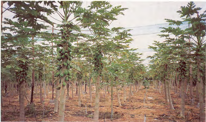
Cultivo de papayas del cultivar Sunrise en la localidad de Valle de Guerra (zona norte).

La papaya se adapta a una muy variada gama de suelos, aunque siempre es preferible que éste sea areno-limoso, con buena estructura, rico en materia orgánica y principalmente con buen drenaje y aireación. El pH óptimo está comprendido entre 5.5 y 6.5, pero puede cultivarse sin graves problemas hasta pH8. En cuanto a su tolerancia a las sales, parece ser más resistente que la platanera, aunque en zonas costeras los daños causados por la “maresía” son considerables.