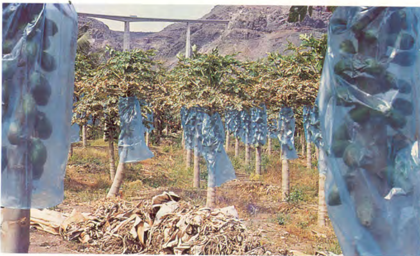
Embolsado de la fruta para protegerla de la maresía y otros daños mecánicos.

Es conveniente proceder al aclareo de los frutos cuando éstos estén recién cuajados con el fin de evitar rozaduras y conseguir frutos más homogéneos y de mayor tamaño, siendo aconsejable dejar un máximo de 2-3 frutos por pedúnculo en el cultivar Sunrise y siempre evitando problemas de compactación.