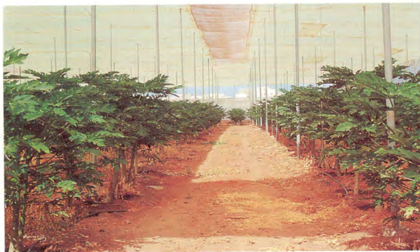
Invernadero de papayas del cultivar Sunrise en la localidad de Las Galletas (zona muy ventosa).

cultivares a este respecto, así los menos sensibles a este problema son Sunrise, Higgins y Kapoho, pero por otra parte, estos dos últimos no son los más productivos, lo que conduce a que sólo sea considerado como idóneo dentro del grupo “Solo” para su cultivo en Canarias el cultivar Sunrise.