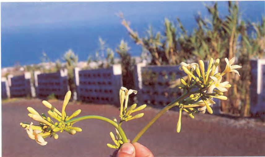
Inflorescencia masculina de papaya.

Las flores femeninas en condiciones normales necesitan el polen de las masculinas o hermafroditas para producir fruta aunque en muchas ocasiones en los subtrópicos y particularmente en Canarias pueden desarrollarse partenocápicamente. Las frutas más comerciales son sin embargo las hermafroditas. Es deseable por ello disponer en la plantación de plantas hermafroditas únicamente o mayor porcentaje de hermafroditas que de femeninas, con lo cual tendremos por un lado una adecuada polinización de las flores femeninas y por otro frutos hermafroditas que son los de mayor demanda en los mercados. Evidentemente las plantas masculinas también permiten polinizar las flores hermafroditas y femeninas.