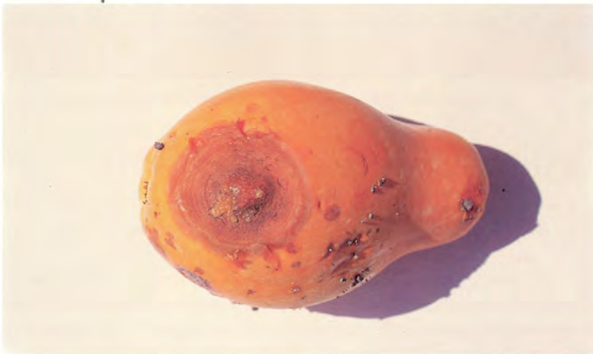
Fruto de papaya con síntomas evidentes de la presencia del hongo Colletotrichum gloeosporioides (Antracnosis).

- Pudrición de la raíz o chancro del tallo. (Phytophthora palmívora): Aparece de forma esporádica produciendo lesiones graves en la planta que acaba por morir. Para el control del hongo se podría utilizar