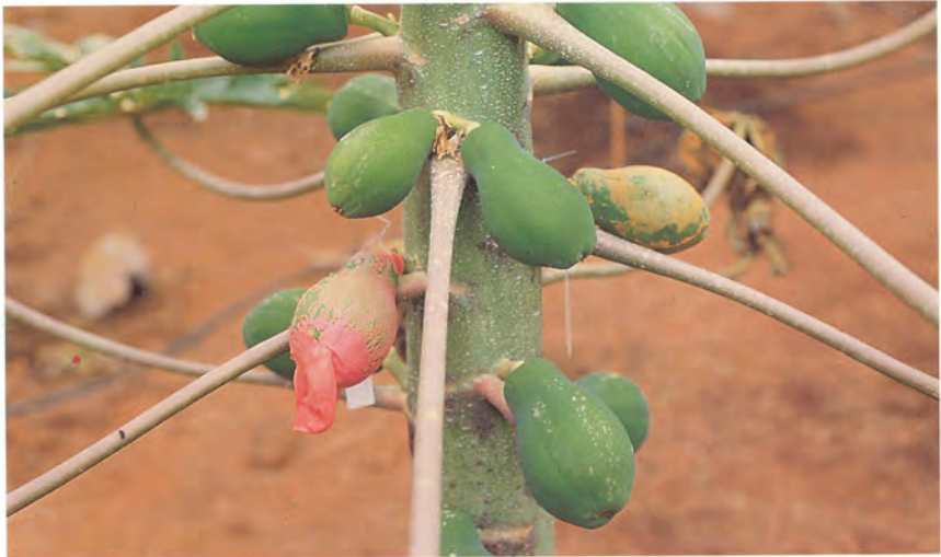
Fruto hermafrodita obtenido mediante polinización controlada.

Control: La aplicación reiterada de Dithane M-45 (m.a. mancozeb) a la dosis 2-3 cc /l ha dado buenos resultados.