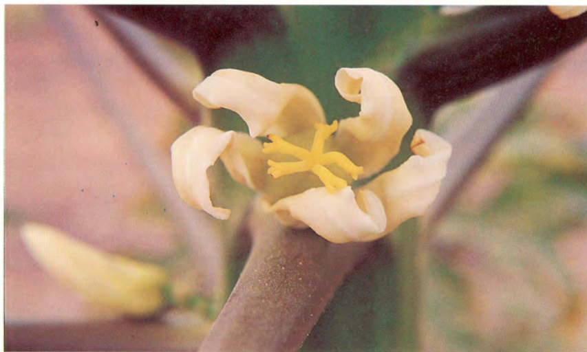
Flor femenina de papaya.