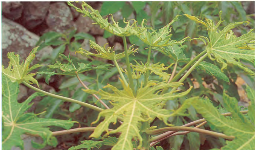
Síntomas de ataque de ácaros en hojas jóvenes y adultas de papaya.

Control: Lannate (m.a. metomilo). Dosis 2 cc/l.