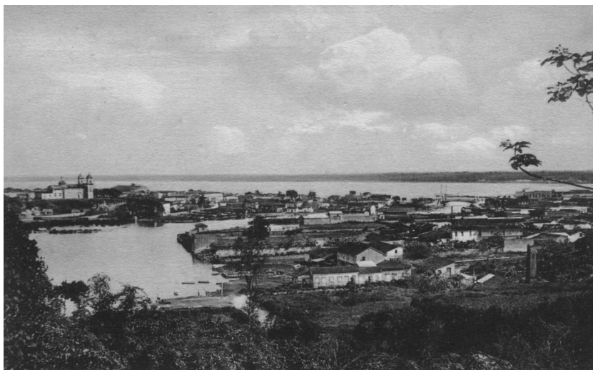
Matanzas. Postal de principios del siglo XX