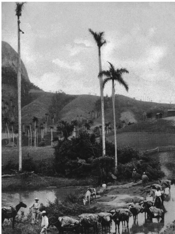
Postal de principios del siglo XX