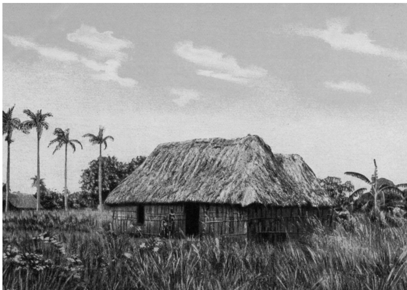
Bohío. Postal cubana de principios del siglo XX