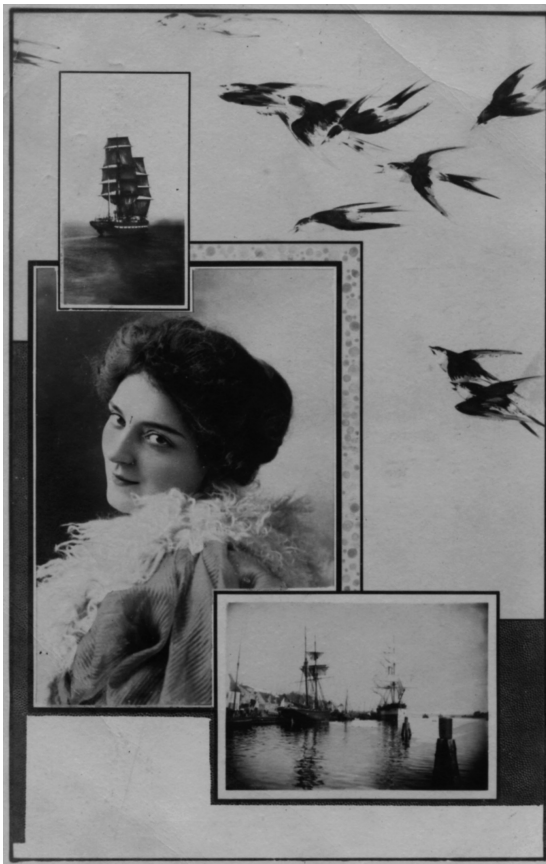
Postal alusiva a la emigración de principios del siglo XX