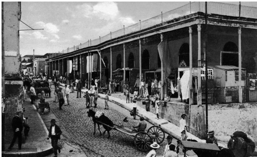
Postal cubana circulada a mediados de la década de 1920