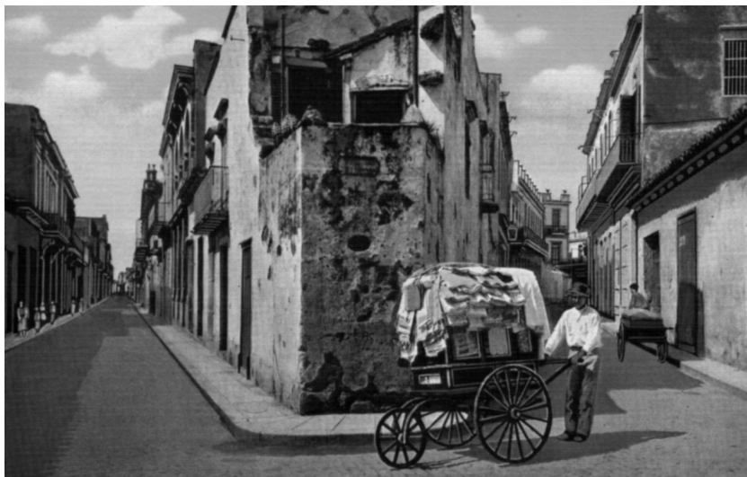
Postal de la década de 1920