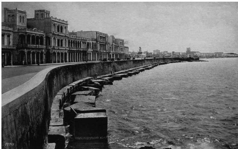
Postal de principios del siglo XX