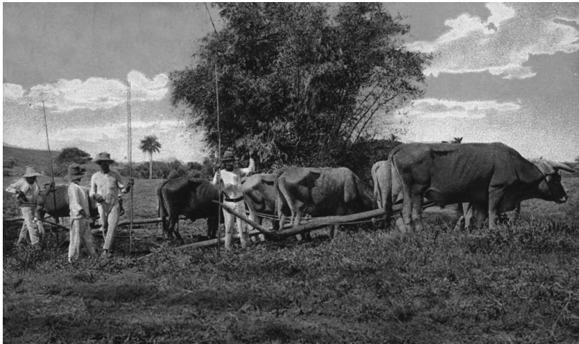
Postal cubana del primer cuarto del siglo XX