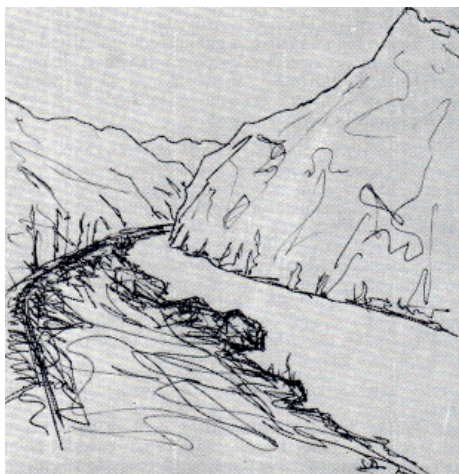
Figura 5: Imagem de esquisso de Sant’Anna Dionísio “Alto Douro – O rio a montante da Quinta do Vesúvio” (Dionísio, 1995a).

Tal como afirma Dionísio, no prefácio do I Tomo de Trás-os-Montes e Alto Douro , o ponto de vista apresentado é “novo”. Atente-se, a propósito, na definição de guia do autor: “Um Guia é, por definição, uma obra de compromisso em que se conjugam, à medida que vão sendo precisas, indicações ou sugestões de ordem geográfica ou arqueológica, aqui e além associadas a outras que poderão ser discretamente reflexivas e até, por vezes, moderadamente inefáveis” (Dionísio 1995a, p. XXV). Não se trata dum simples guia, mas dum autêntico diário de viagens, contendo descrições detalhadas dos espaços a visitar, mas também reflexões sobre a paisagem, o homem duriense, a singularidade do destino.