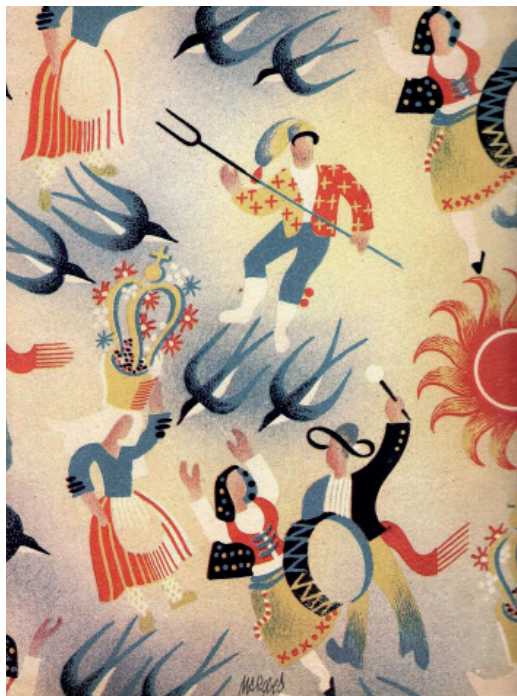
Guia (S.n. s.d.)