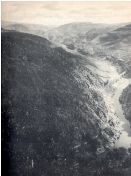
Fotógrafo anónimo. Guia (S.n. s.d. )

Nos mais recentes, aparece a cor, quer em fotografias quer em reproduções de desenhos, de pinturas, de cartazes, de rótulos, de gravuras (Foto 3).