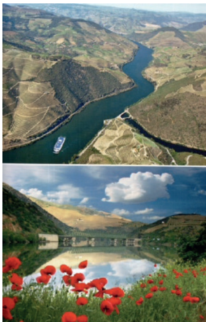
Guia (Veloso, Fonseca & Fonseca, 2010)