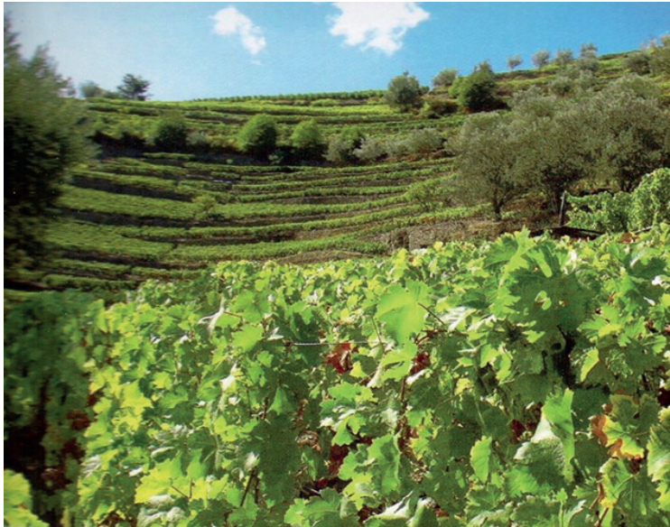
Figura 6: “Escadório monumental de geios ou socalcos”.