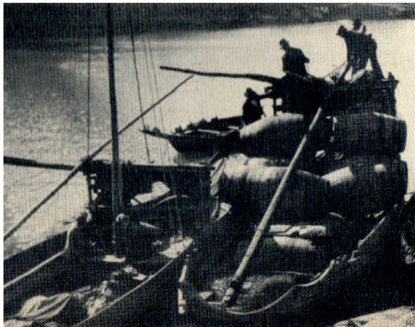
Guia (S.n., s.d)

O grande destaque promocional, ou seja, a imagem “construída para venda” (Santana Talavera, 2015, p. 42) do território duriense, salientava, sobretudo, a proeminência da cidade do Porto, que, aliás, nomeia o vinho generoso, subalternizando a imagem construída sobre a paisagem duriense produtora do vinho. Nos guias de viagem redigidos no Estado Novo, a principal imagem a encenar era a dum país “perfeito”, dum espaço diversificado de paisagens litorais e interiores, continentais e ultramarinas, carregado de marcas históricas materializadas nos seus monumentos e na sua diversidade cultural.