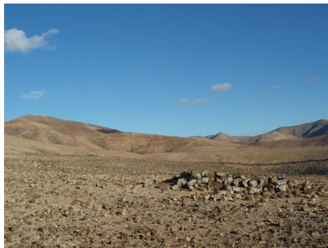
FIGURAS 21 y 22.- Ejemplos de otras tipologías de edificios conservados en el yacimiento.