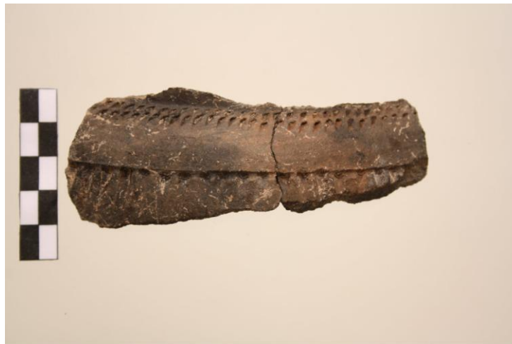
FIGURAS 13, 14 y 15. Fragmentos cerámicos documentados en el nivel de ocupación U.E. 15.

En este primer momento el lado este, donde efectuamos el sondeo B, se articularía como un gran espacio abierto en principio sin construir y usado como zona de vertido de desechos o basurero. En él abundan restos óseos de ovicápridos fundamentalmente pero también restos de ictiofauna, entre la que destaca una pieza vertebral de un pez de grandes dimensiones y un potente vertido de lapas localizadas in situ . (Figs. 16, 17 y 18)