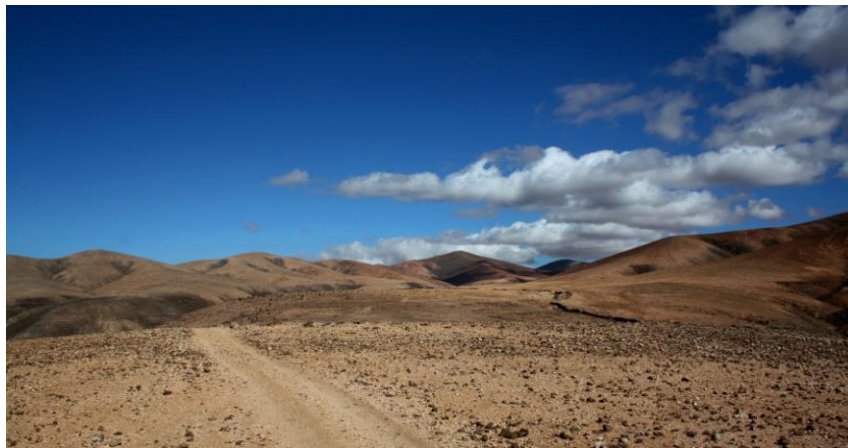
FIGURA 3. Vista general del sector norte del yacimiento donde se localiza el edificio Casa del Rey.

Mención aparte merece la comúnmente conocida como Casa del Rey que ha sido objeto de la intervención arqueológica cuyos resultados aquí presentamos. Se trata de un edificio de planta compleja e irregular de 54 metros de anchura por 50 metros de longitud compuesto por cuatro espacios bien diferenciados en algunos casos con compartimentaciones interiores. (Fig. 3)