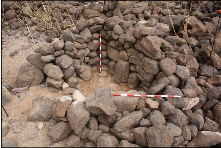
FIGURA 10. Vista general de las estructuras conservadas en el sondeo A.

A diferencia de la estructura U.E. 12 del sondeo B el cerramiento en esta zona es doble. En primer lugar, podemos observar el muro U.E. 20 cuyo desarrollo hacia el norte nos describe un muro de bastante potencia y tendencia recta, no circular. En este muro se aprecian varias entradas que conectan unos espacios que se amplían hacia el este y otro espacio mayor semicircular que se abre hacia el oeste cuyo arranque se observa en el muro U.E. 21, también perteneciente a esta primera fase constructiva y parcialmente cubierto por su propio derrumbe. De este modo, contaríamos con un patio que serviría de tránsito entre el exterior y el interior del espacio habitacional. (Fig. 10 y 11)