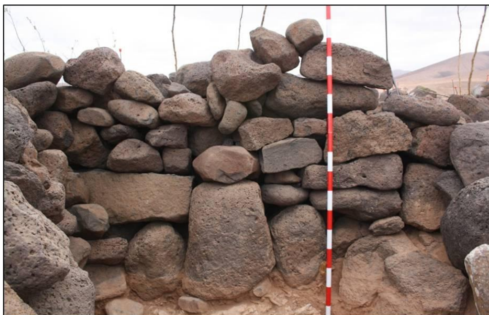
FIGURA 6. Detalle de la cara oeste del muro U.E. 20.

La excavación de este sondeo ha adquirido una potencia de 66 cm. desde la cota de suelo actual hasta el nivel geológico, lo cual nos ha permitido constatar la existencia de diferentes momentos de ocupación de este sector desde época preeuropea y reconstruir el proceso constructivo de esta zona.