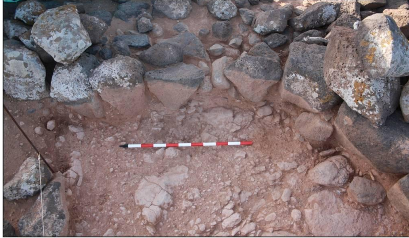
FIGURA 19. Estructura adscrita a la segunda fase constructiva constatada en el sondeo B.

Por su parte, en el sector este, con posterioridad al abandono y progresivo proceso de colmatación constatamos una ocupación muy puntual de época moderna.