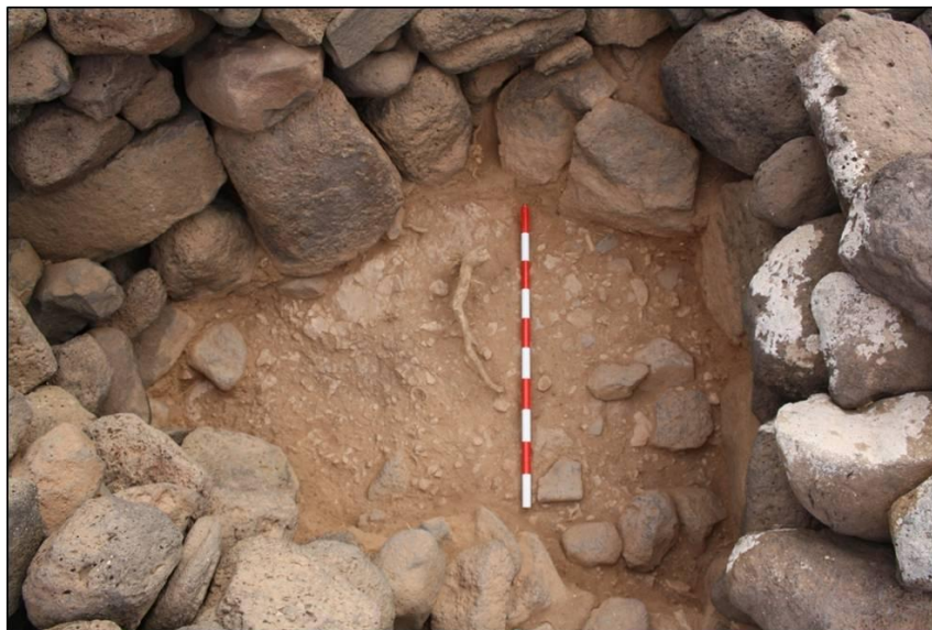
FIGURA 12. Nivel de ocupación U.E. 15 constatado en el sondeo A.

En resumen este sector del yacimiento estaría en principio formado por una zona habitacional central a la que se accede a través de un gran patio que se abre hacia el sureste. En esta zona ha sido detectado a una cota máxima de 196,83 m.s.n.m y mínima de 196,70 m.s.n.m un nivel de ocupación o suelo U.E. 15 asociado a esta primera fase constructiva. Se trata de un estrato de matriz arcillosa, compactación media y tonalidad castaña clara que presenta abundante material arqueológico asociado (restos óseos animales, industria lítica, cerámica y malacofauna). (Fig. 12)