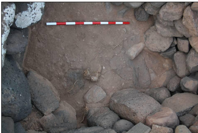
FIGURA 20. Fosas de época moderna detectadas en el lateral este del sondeo A.

De este periodo encontramos varias fosas cenicientas que ocupan el sector oeste y que fueron documentadas en el sondeo A. Estas fosas contienen algunos fragmentos cerámicos de loza blanca decorada en azul que creemos pueden encuadrarse entre los siglos XV y XVI, si bien estos datos están aún por confirmar. Tenemos que decir que no han sido documentados restos cerámicos de esta cronología en otros puntos del yacimiento, ni siquiera a nivel superficial. Esta ocupación no deja de ser un hecho puntual que se reduce a la presencia de estas dos fosas que hayamos rellenas de ceniza, carbón y algún resto de malacofauna, situadas al resguardo de unos muros que alcanzan una altura de casi 70 cm. (Fig. 20)