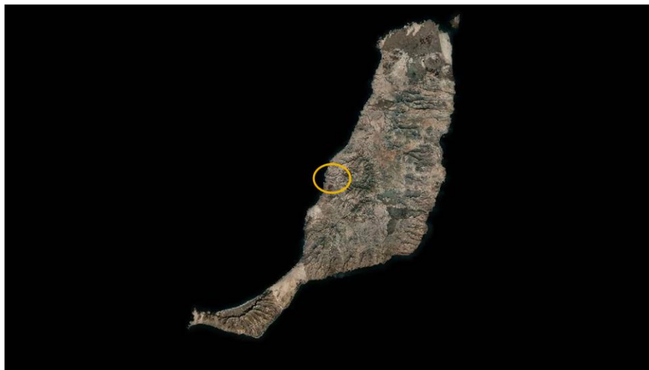
FIGURA 1. Situación del yacimiento. OrtoExpress 1:25.000.

En la actualidad estos terrenos pertenecen al Mancomún de Betancuria, donde pastan las cabras de costa y en la que se continúan realizando apañadas. Para realizar dichas apañadas se han construido, en la zona sur-occidental del yacimiento, corrales de planta circular denominados gambuesas y algunas habitaciones anexas a ellas.