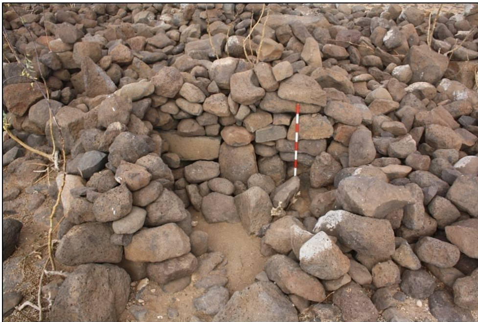
FIGURA 5. Estado del sondeo A con anterioridad a su excavación.