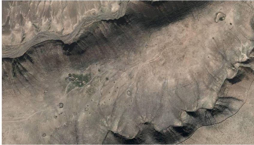
FIGURA 2. Vista aérea de las estructuras que forman el yacimiento Llano del Sombrero. OrtoExpress 1:25.000.

El yacimiento Llano del Sombrero abarca una extensa superficie en la que podemos observar unas 30 estructuras que ocupan la parte alta del llano y su ladera sur, que mira hacia Madre del Agua, mientras que la ladera norte que mira hacia el barranco de la Peña se encuentra prácticamente despoblada. (Fig. 2)