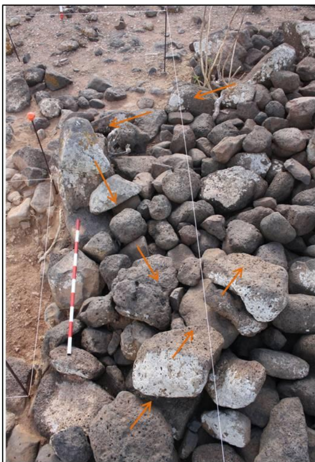
FIGURA 8. Muros circulares que constituyen el cerramiento de la posible zona doméstica por el este.