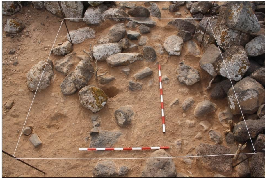
FIGURA 7. Sondeo B en los momentos iniciales de su excavación.

cambios sedimentológicos o variaciones macroscópicas de los mismos, aislándose de forma individual dichas unidades o niveles y subunidades o capas. (Fig. 7)