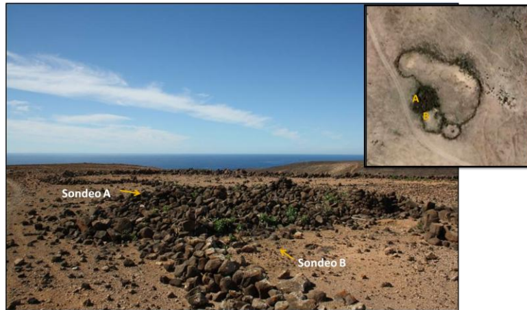
FIGURA 4. Planta, vista general del edificio denominado Casa del Rey y situación de los sondeos A y B.

De estos cuatro espacios podemos distinguir una sola zona que se encontraría cubierta en origen. Nos referimos a un área conformada por pequeños espacios de tendencia circular construidos por grandes bloques de piedras dispuestos en seco y que podría corresponder a una posible zona doméstica. Sin embargo, a día de hoy es muy difícil determinar claramente su planta, debido a que los potentes niveles de derrumbe desdibujan la alineación de sus estructuras murarias. (Fig. 4)