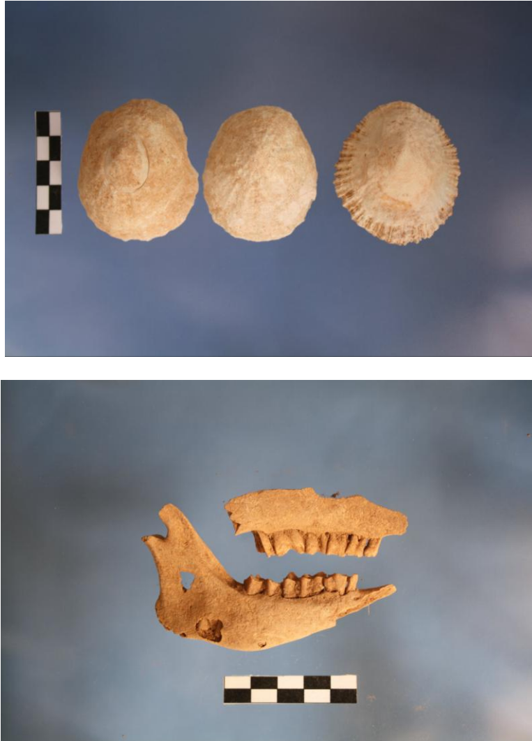
FIGURAS 16, 17 y 18. Vista de detalle del basurero o vertido hallado en el sondeo B y Patella_spp y ovicáprido asociados al mismo.

En un momento indeterminado el basurero cae en desuso, se colmata y con posterioridad este sector es reformado, ampliándose el yacimiento hacia el este.