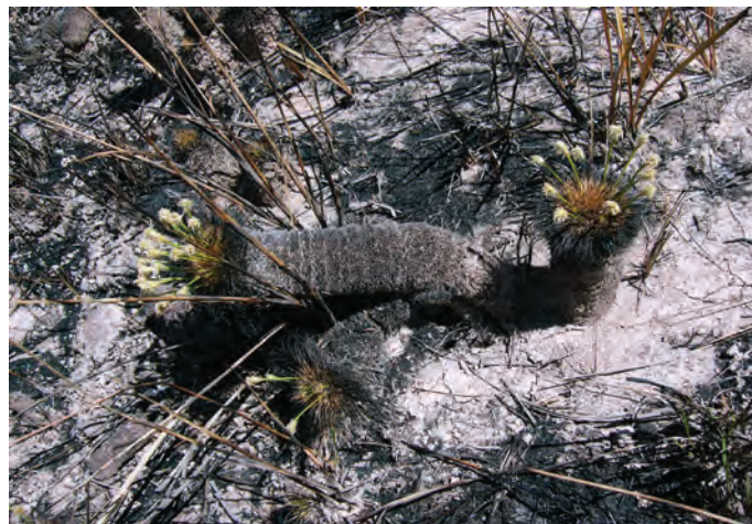
Figura 05: Bulbostyles paradoxa . Espécie resistente ao fogo.

de 9 km, cerca de quatro horas até o pé do monumental Monte, que passa pelo acampamento na base no sopé, nesta caminhada é possível ver a espécie vegetal resistente ao fogo, a Bulbostylis paradoxa (CYPERACEAE) e a (RAPATEACEAE) parente da Africana “Estegolepsy”.