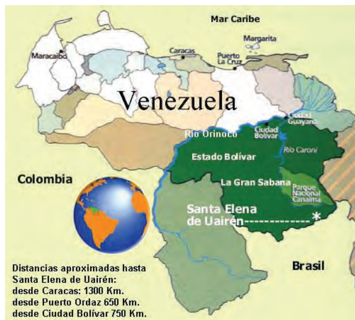
Figura 03: Mapa da localização do Parque Nacional Canaima.

Bolívar” ou “Troncal 10” a continuação da