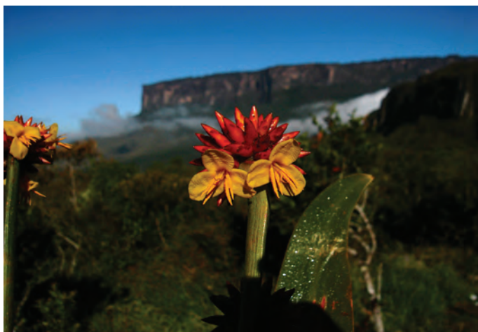
Figura 04: RAPATACEAE - parente da espécie africana “Estegolepsy”.