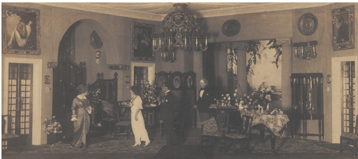
Fig. 2. Fotografía de Sacrificios. 1913.

Está claro que en el montaje aún persiste esa idea de mimesis de la realidad. Pero la novedad escénica es evidente al ser distinto a los anteriores. Lo que no sabemos es hasta qué punto Néstor conocía estas teorías. Tampoco sería raro que las conociera ya que no debemos olvidar que había residido en distintos lugares de Europa, como Madrid, París o Londres, donde pudiera haber tenido contacto con ellas.