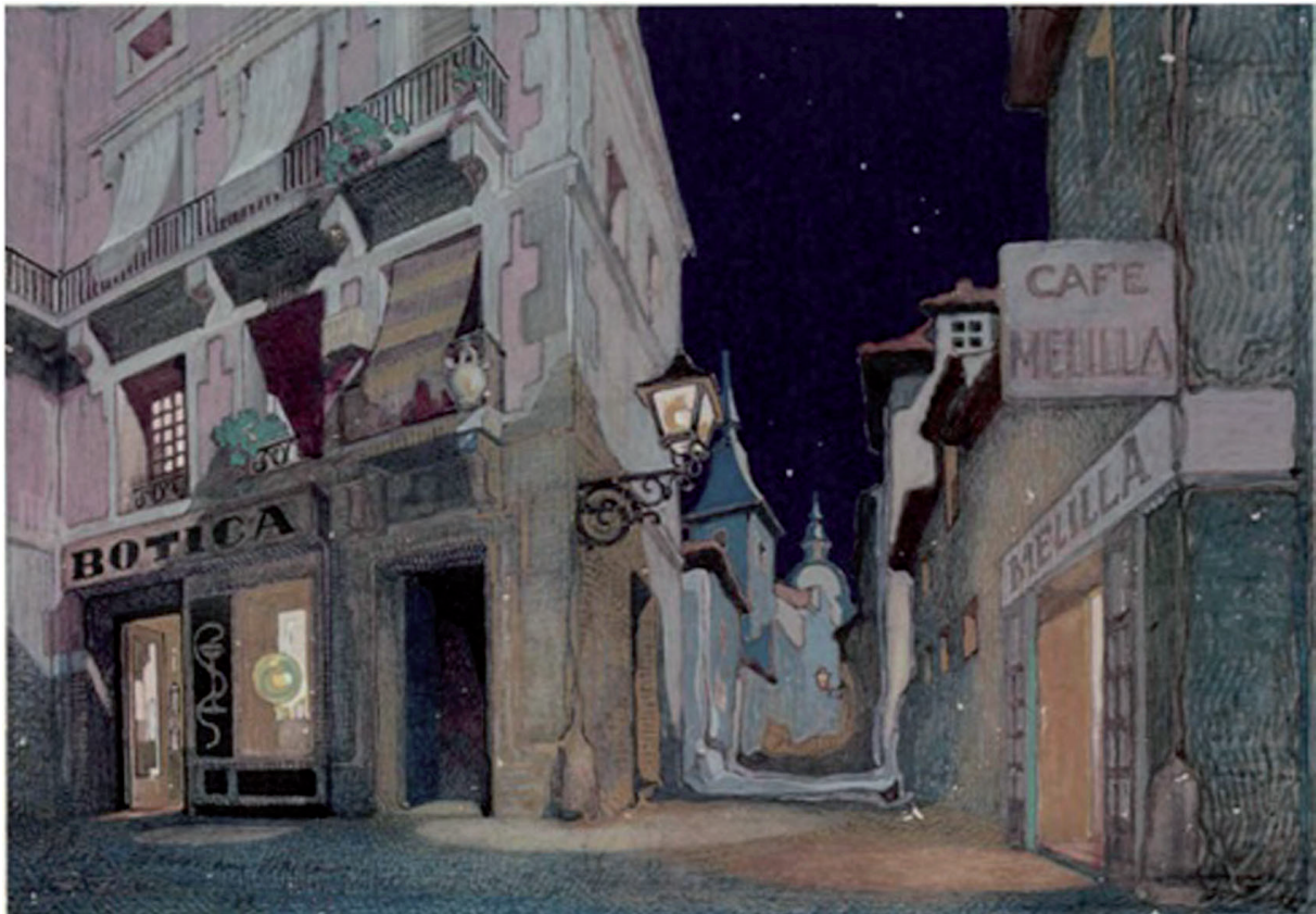
Fig. 7. Escenografía para La verbena de la Paloma . Néstor Martín-Fernández de la Torre. 1937. 29 x 40 cm. Colección del Cabildo de Gran Canaria, en depósito en el Museo Néstor.

Tras establecerse definitivamente en su ciudad natal, las escenografías de Néstor presentan una mayor precisión lineal y de la perspectiva, como se observa en el boceto de La verbena de la paloma [Fig. 7]. Aunque el color sigue siendo la nota dominante en toda la representación. Pero lo más importante de esta etapa no es ya la superación del decorado realista, que es evidente, sino el adelanto que supone que ruegue al público asistente a los palcos y plateas que llevara mantones de manila 44 .