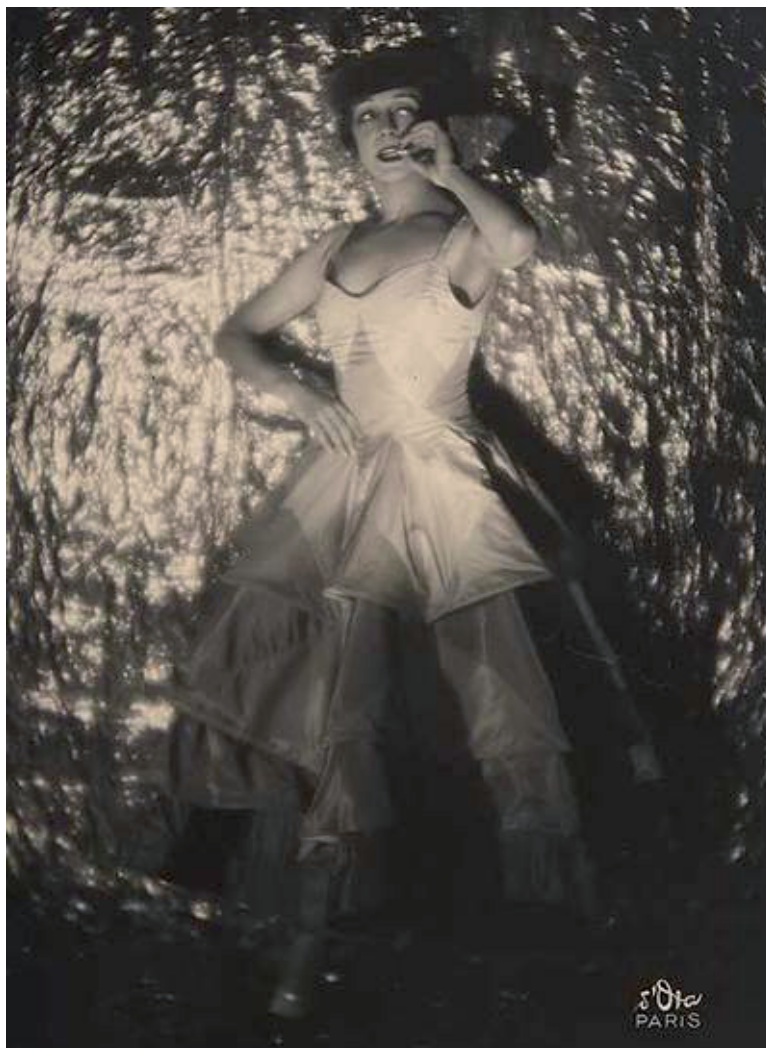
Fig. 6. Fotografía de Antonia Mercé “La Argentina” como La niña bonita para El fandango de candil. 1927.

Además, en parte de esta producción escénica, claramente en Triana , también observamos un gran gusto por el decorativismo, los colores cálidos y el exotismo, como evidencia las tuneras canarias que representa en las dos escenografías conservadas, que rayaría el sentido del art déco .