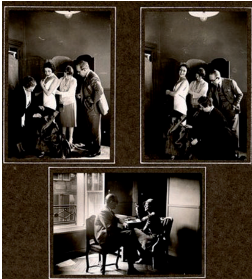
Fig. 1. Fotografías de Néstor y Antonia Mercé “La Argentina”. 1929. Extraídas de Legado de Antonia Mercé “La Argentina”. Archivo digital de la Fundación Juan March. Álbum 10, p. 9

nes efímeras 9 . Nuevamente estuvo vinculado con las sociedades, principalmente la Sociedad Amigos del Arte Néstor de la Torre , auténticas promotoras de la dinamización de la cultura de la capital grancanaria en estos años. Participó en la puesta en escena de La sirena varada , de Alejandro Casona (1936, Teatro Pérez Galdós), Una noche romántica , inspirándose en la música de Chopin (1937, Teatro Pérez Galdós), La verbena de la paloma , con libreto de Ricardo de la Vega y música de Tomás Bretón (1937, Teatro Pérez Galdós), y las diferentes fiestas y espectáculos regionales (1934 y 1938, Teatro Pérez Galdós).