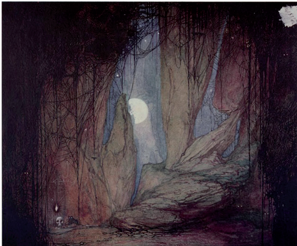
Fig. 3. Escenografía para El amor brujo . Néstor Martín-Fernández de la Torre. 1915. Gouache sobre cartulina. 25 x 31 cm. Museo Néstor.

sonados fracasos en la Historia de la renovación escénica española al romperse unos de los principios básicos de ésta: la armonía. Todo comenzó cuando Martínez Sierra declaró que se encontraba a la cabeza de la creación artística de la obra 25 . Contrariado, Falla le responde públicamente 26 colocando la música por encima del resto de los elementos que conforman la obra 27 . Unido a ello, Martínez Sierra decidió modificar la dirección escénica que desarrollaba el canario sin consultarle al alterar la iluminación del espectáculo para potenciar la figura de Pastora Imperio 28 .