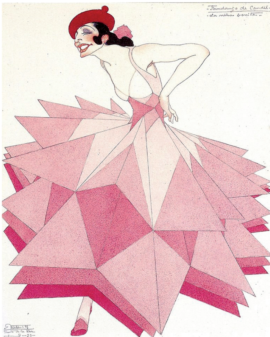
Fig. 5. Figurín de La niña bonita para El fandango de candil. Néstor Martín-Fernández de la Torre. 1927. 26 x 22 cm. Museo Néstor.

Con todo, merecen mención aparte los figurines [Figs. 5 y 6] para las bailarinas que realizó para esta compañía. Son uno de los más bellos e importantes que diseñó debido al carácter geométrico y a los recortes angulosos que en ellos predomina, principalmente en aquellos destinados a la protagonista. Por lo que consideramos que están ligados al lenguaje constructivista y poscubista que Néstor conocía perfectamente, como revela el hecho en su biblioteca poseyera libros sobre el teatro ruso donde se reproducían diseños de Goncharova, Exter o Popova 40 .