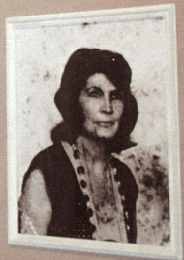
Vê, aos quarenta, com docura, De seus filhas a ventura.