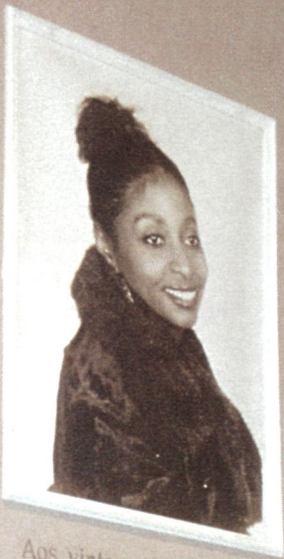
Aos vinte, a vida De ilusões está preenchida.