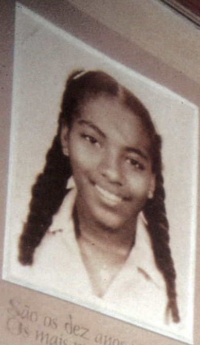
São os dez anos primeiros Os mais puros e sinceros.