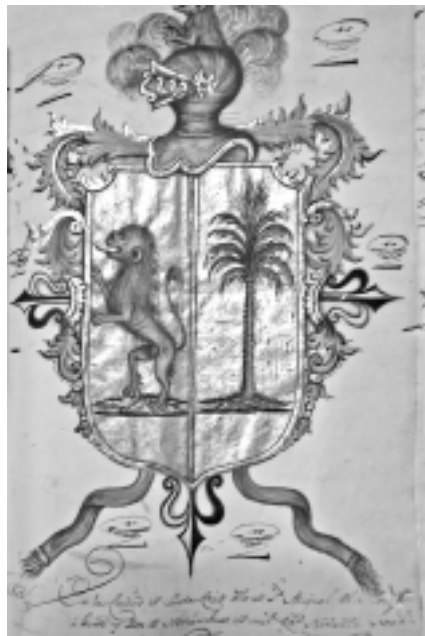
Escudo de armas de los Fernández de Medina.

FERNÁNDEZ GARCÍA, Alberto José. «Notas históricas de La Palma: San Telmo». Diario de Avisos , 17,18,19 y 20 de septiembre de 1969.