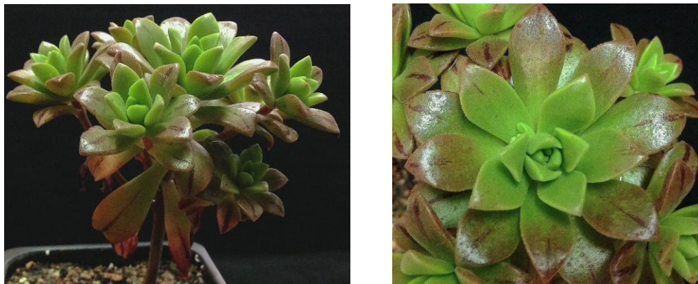
Figura 5. Ejemplar joven del cruce-3, A. decorum x A. sedifolium , recientemente descrito como A. x puberulum Bañares & A. Acev.-Rodr.

generación F2. Por todo esto defendemos aquí la aceptación de A. mascaense como buena especie y sea aceptada de nuevo como tal en el Biota de Canarias (ARECHAVALETA et al. 2010).