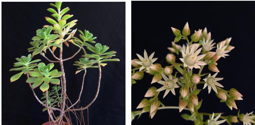
Figura 3.- Planta y flor del cruce-2: A. haworthii x A. decorum , en la que se puede apreciar la diferencia con A. mascaense .