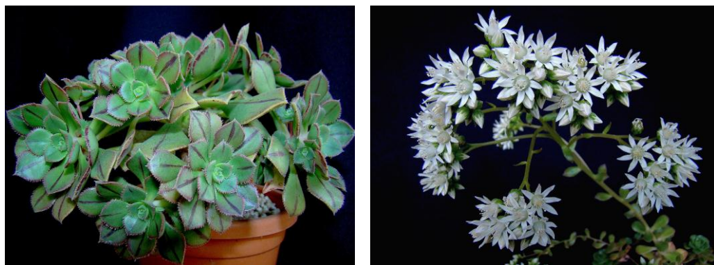
Figura 4.- Planta y flor de A. mascaense de la generación F2 obtenidas por autofecundación.

De este híbrido artificial ( A. haworthii x A. decorum ), nuevo y aún no descrito, se ha realizado su herborización, cuya exsiccata se conserva en el herbario TFC de la Universidad de La Laguna, en Tenerife. Asimismo, consideramos muy probable que este híbrido se dé en la naturaleza, ya que tanto A. decorum como A. haworthii están presentes en el Barranco de Masca y florecen en la misma época del año (KUNKEL, 1980; HERNANDEZ, 1998; BRAMWELL & BRAMWELL, 2001).