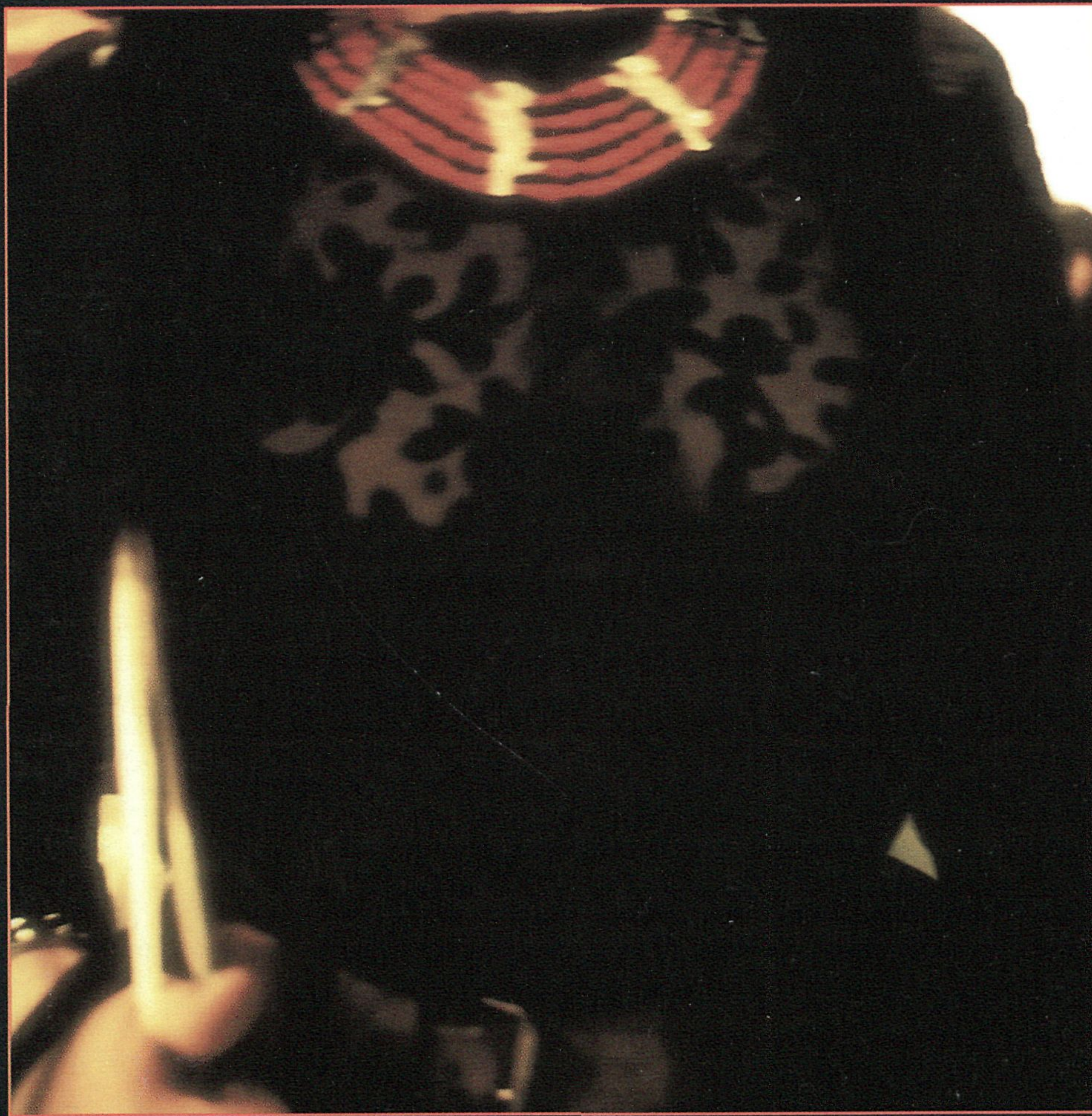
Miguel Río Branco. Colección Recorridos Fotográficos ARCO

PARQUE FERIAL JUAN CARLOS I, MADRID. ESPAÑA