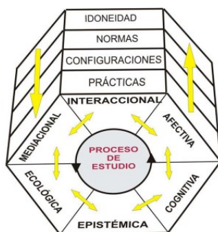
Figura 2: Facetas y niveles del conocimiento del profesor (Godino, 2009, p. 21)

Como se muestra en la Figura 2, el conocimiento didáctico-matemático del profesor se encuentra constituido por las siguientes categorías de conocimientos fundamentales necesarios para que un profesor lleve a cabo el proceso de enseñanza y aprendizaje: