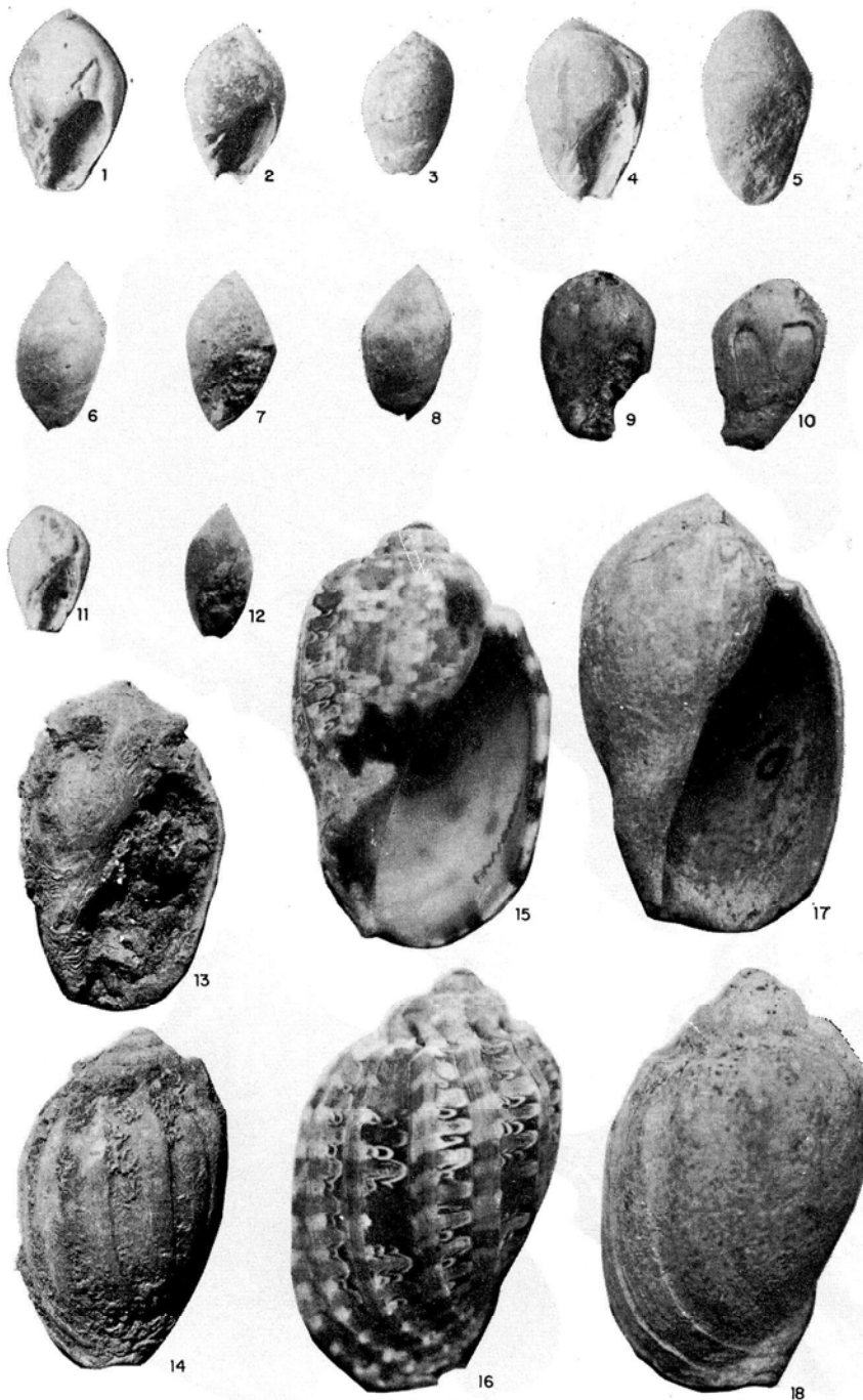
Figs. 1 y 11: Ancilla glandiformis (LAMARCK, 1822). Costa Esmeralda, Jandía (Fuerteventura). Plioceno inferior.—Figs. 2, 3, 4 y 5: Ancilla glandiformis (LAMARCK, 1822). Aljibe de la Cueva, Tcstón (Fuerteventura). Plioceno inferior.—Figs. 6, 7, 8 y 12: Ancilla glandiformis (LAMARCK, 1822). Barranco Seco, Las Palmas (Gran Canaria). Plioceno inferior. Colectó José Moreno Naranjo. Museo Canario.—Figs. 9 y 10: Ancilla glandiformis (LAMARCK, 1822). Punta del Garajao (Lanzarote). Plioceno inferior.—Figs. 13 y 14: Harpa rosea (LAMARCK, 1816). Matas Blancas (Fuerteventura). Pleistoceno superior. Ultimo interglacial (nivel con Strombus bubonius ).—Figuras 15 y 16: Harpa rosea (LAMARCK, 1816). Isla de Annobón. Ejemplar actual para comparación. Colectó J. Meco. Museo Canario.—Figs. 17 y 18: Harpa rosea (LAMARCK, 1816). Matagorda (Lanzarote). Pleistoceno superior. Ultimo interglacial (nivel con Strombus bubonius )