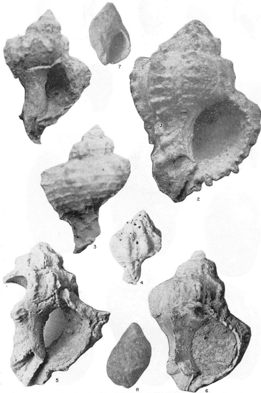
Figs. 1 y 3: Murex saxatilis (LINNÉ, 1758). Salinas de Matagorda (Lanzarote). Pleistoceno superior.—Fig. 2: Murex saxatilis (LINNÉ, 1758). Las Palmas (Gran Canaria). Pleistoceno superior. Museo Canario. Clasificó G. Lecoñtre como Murex hoplites (P. FISCHER).—Fig. 4: Murex saxatilis (LINNÉ, 1758). Matas Blancas. (Fuerteventura). Pleistoceno superior.—Fig. 5: Murex saxatilis (LINNÉ, 1758). El Berrugo (Lanzarote). Pleistoceno superior.—Figura 6: Murex conglobatus (MICHELOTTI, 1841). Punta del Garajao (Lanzarote). Plioceno inferior.—Figs. 7 y 8: Nucella plessisi (LECOINTRE, 1952). Costa Esmeralda, Jandía (Fuerteventura). Plioceno inferior