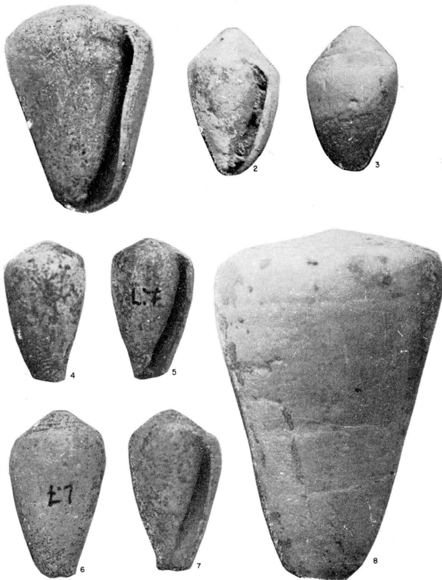
Fig. 1: Conus papilionaceus (BRUGUIERE, 1792). Matagorda (Lanzarote). Pleistoceno superior.—Figs. 2 y 3: Conus pelagicus (BROCCHI, 1814). Punta del Garajao (Lanzarote). Plioceno inferior.—Figs. 4, 5, 6 y 7: Conus testudinarius (BRUGUIERE, 1792). Matagorda (Lanzarote). Pleistoceno superior.—Fig. 8: Conus papilionaceus (BRUGUIERE, 1792). Las Palmas (Gran Canaria). Museo Canario. Clasificó la forma G. Lecointre como Conus prometheus