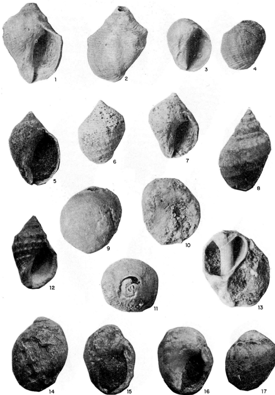
Figs. 1, 2, 6 y 7: Thais haemastoma (LINNÉ, 1767). Matagorda (Lanzarote). Pleistoceno superior.—Figs. 3 y 4: Nucella plessisi (LECOINTRE, 1952). Aljibe de la Cueva (Fuerteventura). Plioceno inferior.—Figs. 5 y 8: Thais haemastoma (LINNÉ, 1767). Las Palmas (Gran Canaria). Clasificó G. Lecointre.—Figs. 9, 10 y 11: Nucella plessisi (LECOINTRE, 1952). Morro Jable, Jandía (Fuerteventura), «55m.». Plioceno inferior.—Fig. 12: Thais haemastoma (LINNÉ, 1767). Las Palmas (Gran Canaria). Pleistoceno superior. Museo Canario. Clasificó G. Lecointre.—Fig. 13: Thais haemastoma (LINNÉ, 1767). Matas Blancas (Fuerteventura). Pleistoceno superior, en el nivel compactado con Strombus bubonius .—Figs. 14, 15, 16 y 17: Nucella plessisi (LECOINTRE, 1952). Punta del Garajao (Lanzarote). Plioceno inferior