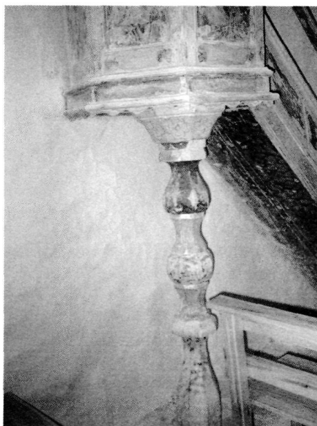
3.2.4. Detalle del Púlpito obra de Juan Bautista Bolaños