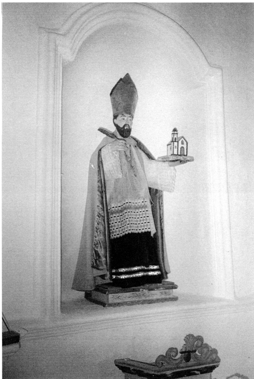
3.2.3. Escultura de San Agustín, presente en la ermita desde los primeros momentos de su construcción