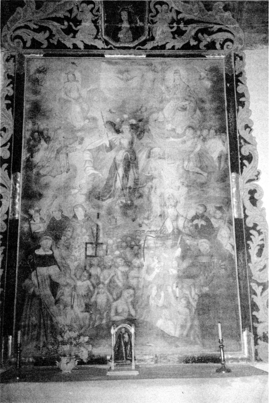
3.2.6. Cuadro de Ánimas que preside el Altar de su propia advocación