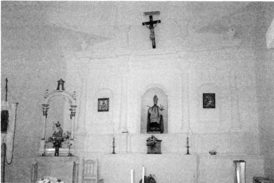
3.2.2. Retablo Mayor presidido por la Escultura de San Agustín