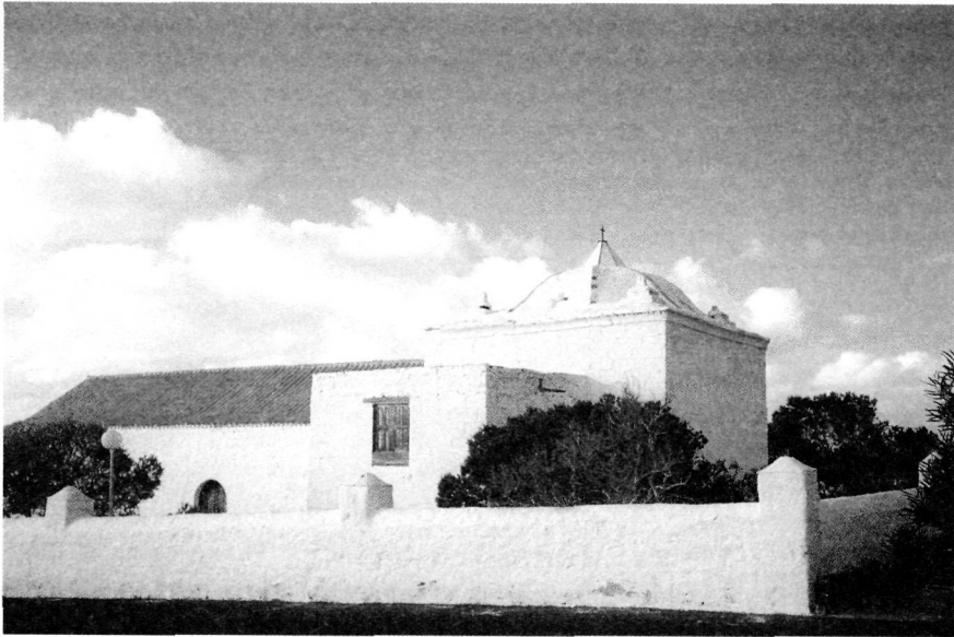
3.2.1. Lado de la Epístola con detalle del Presbiterio y cubierta del mismo