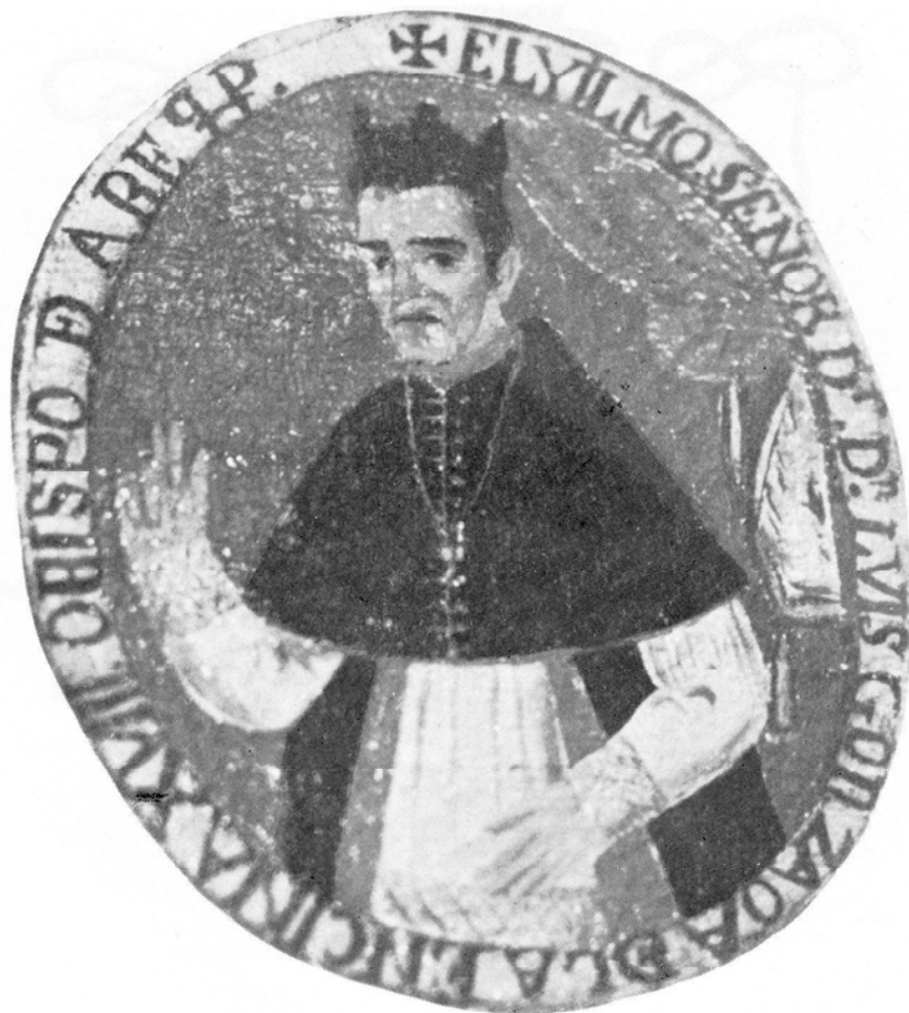
2. El Obispo La Encina (Medallón en un lienzo con la imagen de la Virgen de la Candelaria. Sala Capitular de la Catedral de Arequipa)