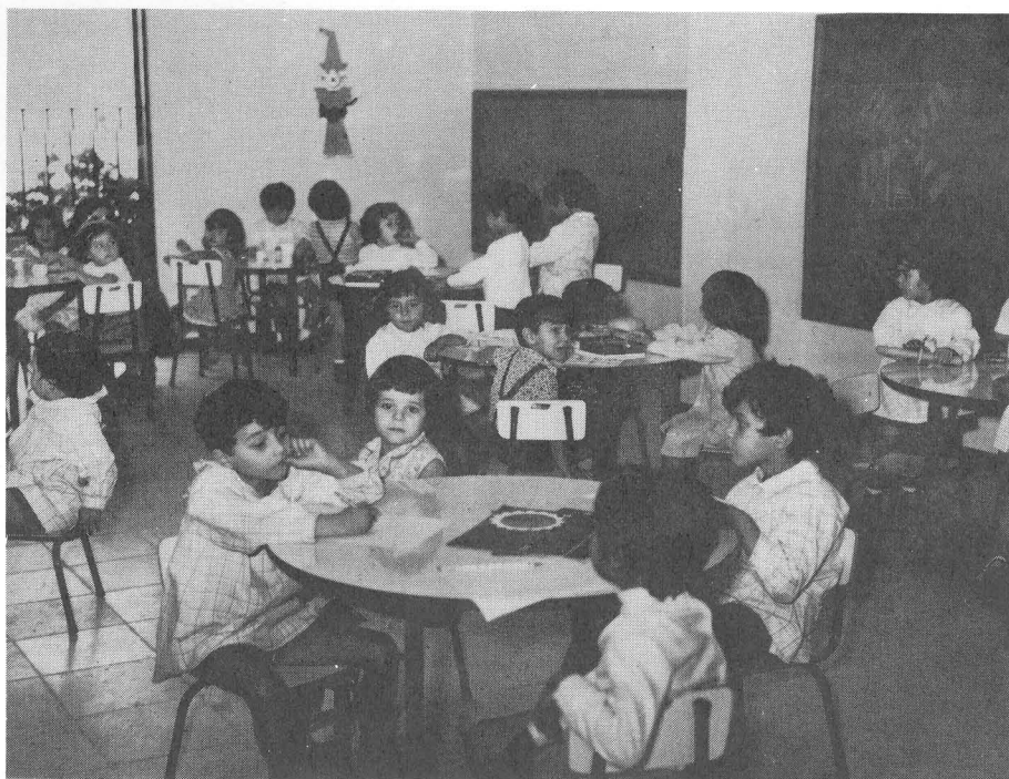
UN GRUPO DE NIÑOS EN EL PARVULARIO INAUGURADO

De carácter más artístico, pero sin perder su dimensión popular, pueden conceptuarse los diversos "conciertos luminosos" llevados a cabo durante los días 27 y 30 y que tuvieron como marco y protagonista la Fuente Monumental situada en la Avenida Marítima, obsequio, como saben nuestros lectores, de la Caja a la Ciudad