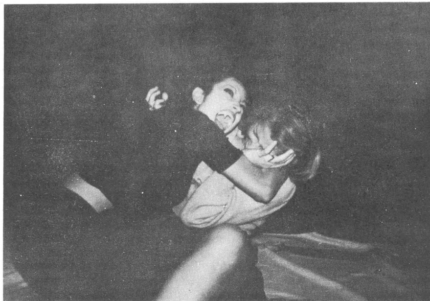
Plano del film "Don Blas, el inquisidor" (1973).

Del abstencionismo de los Amigos Canarios del Teatro, Cine y Música no puedo decir nada, son ellos quienes tienen que decirlo.