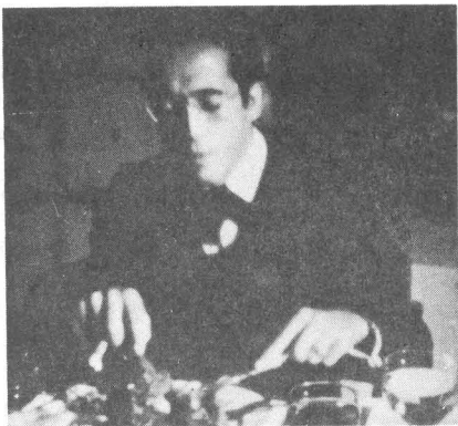
Plano del film "Parto con dolor" (1974).

vía adecuada para lograr el cine canario?