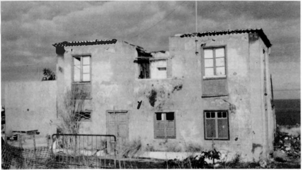
La "Casa Amarilla", residencia de las familias de Teuber y Köhler en Tenerife.

cialmente sobre el comportamiento" (Gómez, 1989).