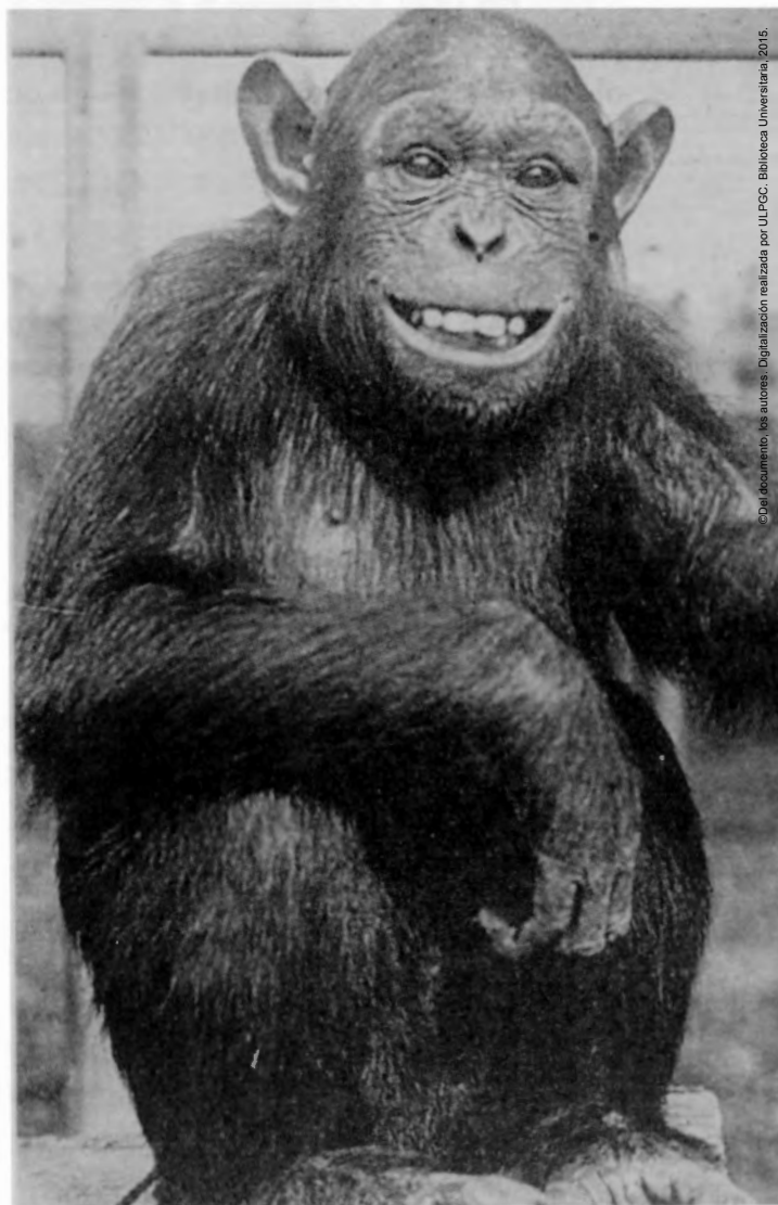
Rana, la primera chimpancé en cautividad que tuvo una cría en Europa (1-5-1921).

isla de Tenerife, en los años 1914-1918, son históricos. Su libro "La Mentalidad de los Monos" es un clásico, como también lo es la fotografía, que aparece en el libro, de un chimpancé tratando de alcanzar un plátano, colgado desde el techo, mediante el uso de cajas y palos. Estos estudios jugaron un papel importante en el origen de la Psicología de la "Gestalt" ("Psicología de la Forma"), cofundada por Köhler. A su vez, se produjo un material abundante para la polémica, que aún continúa, sobre la consciencia de los animales. Desde la pasada década (1980), se ha despertado un renovado interés por Köhler y por el Primer Centro Primatológico de Investigación. 27