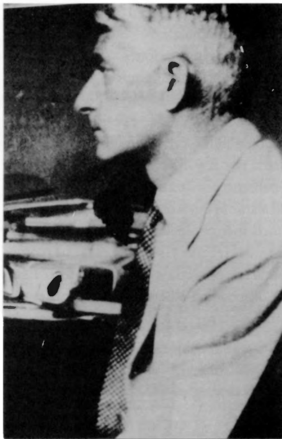
Wolfgang Köhler, amigo de Ortega y Gasset, y Catedrático de Filosofía en la Universidad de Berlín, y director del Instituto de Psicología de la misma institución.