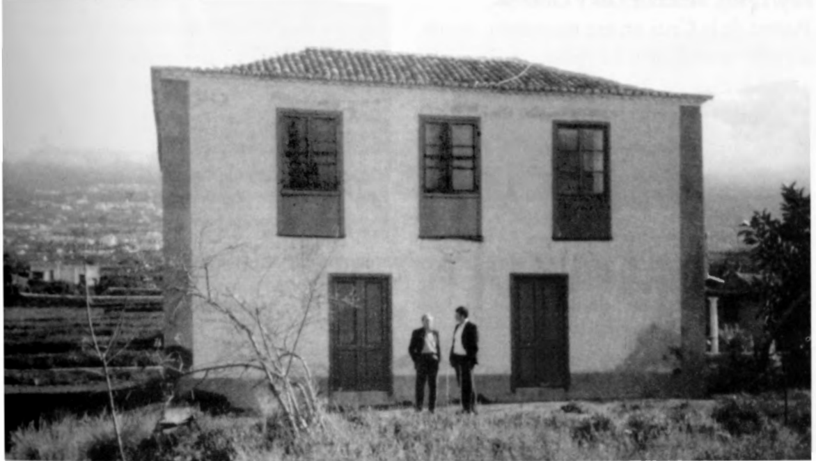
Dos miembros de la Asociación Wolfgang Köhler visitando la “Casa Amarilla”, antes del derribo del inmueble. Foto: Melchor Hernández, 1993.

Durante el primer año de La Estación de Antropoides de Tenerife, el director, Eugen Teuber, realizó una descripción exhaustiva, pero asistemática, del repertorio de conducta de los chimpancés: vocalizaciones, gestos, juego social, juego con objetos, exhibiciones emocionales , coprofagia , uso