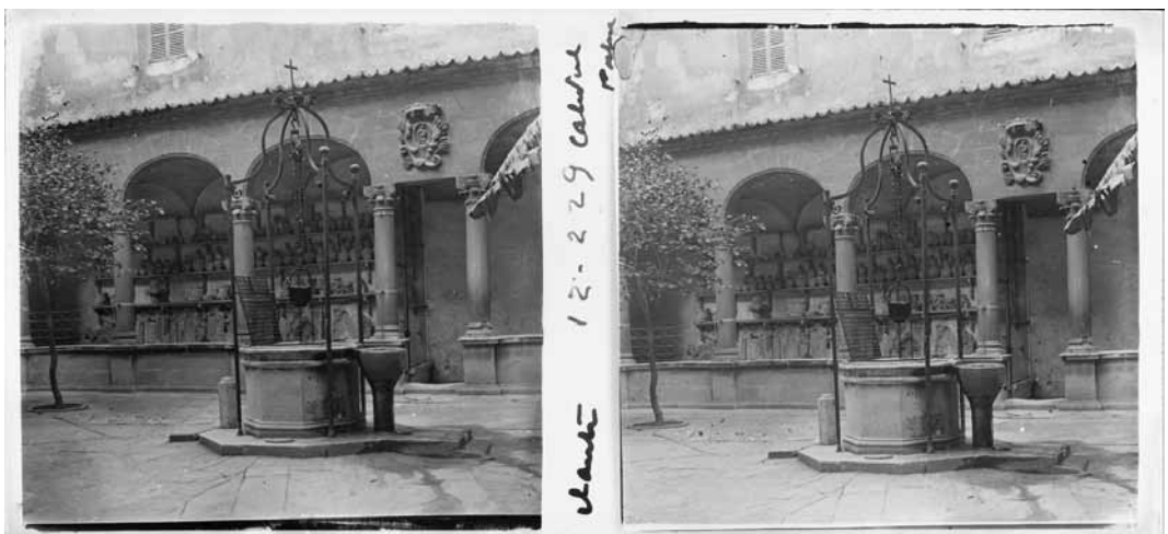
Figura 1. Claustro de la Catedral de Mallorca. 1915. Placa de vidrio estereoscópica, 6x13 cm.