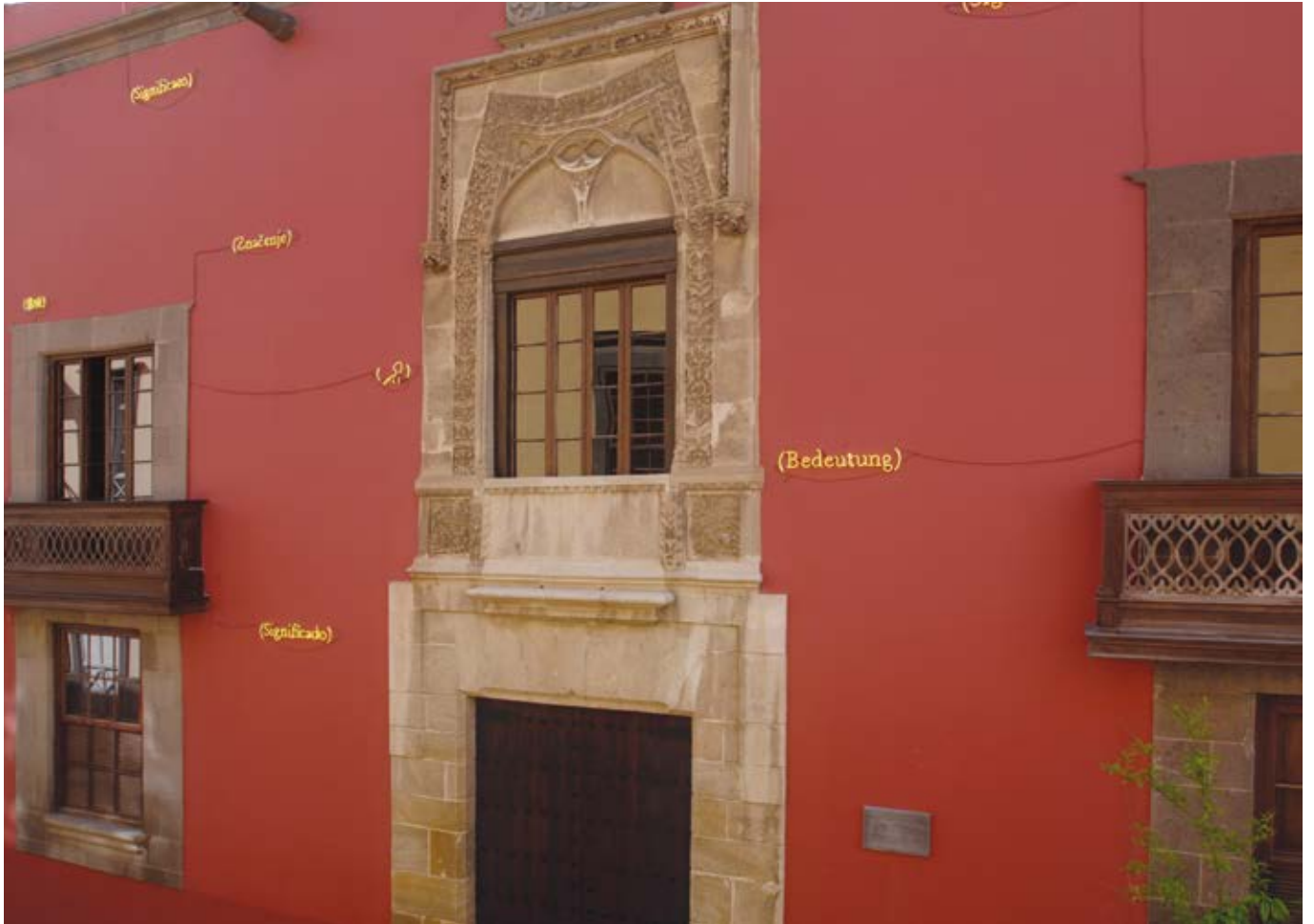
Joseph Kosuth. 14 lugares del significado, fachada del CAAM / 14 Locations of Meaning, façade CAAM, 2007.