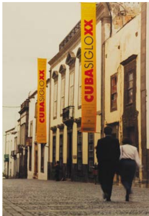
Fachada del CAAM con banderolas anunciando la exposición / Façade CAAM with banners announcing the exhibition "Cuba Siglo XX. Modernidad y sincretismo", 1996.