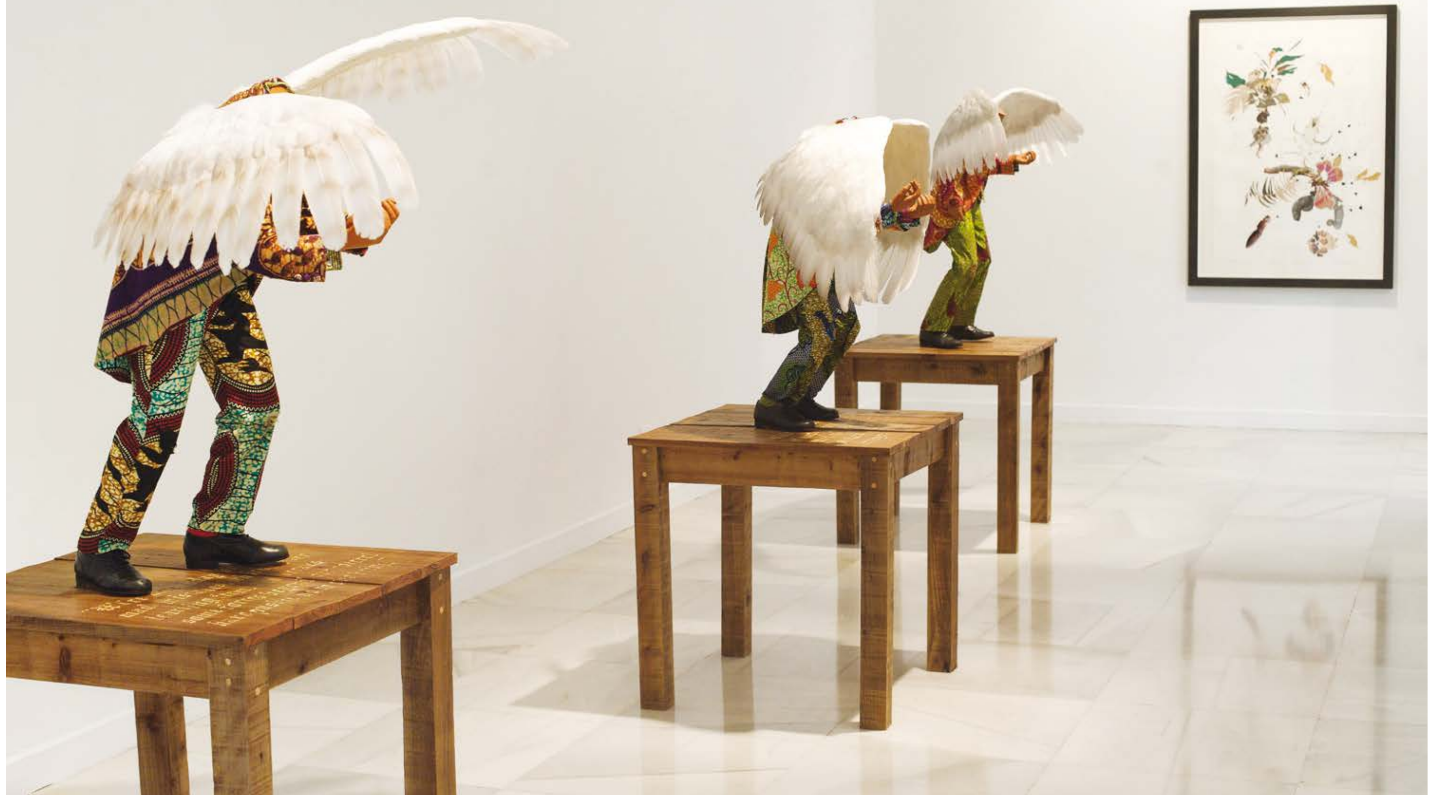
Yinka Shonibare, The Big Three , 2009, en la exposición "El futuro del pasado", CAAM, 2012 / in the exhibition "The Future of the Past," CAAM, 2012.