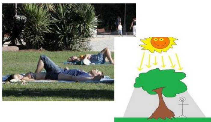
Figura 2. Tarea “La sombra en el patio de recreo”, tal y como se presenta a los alumnos 3

Como os habréis dado cuenta, el picudo ha obligado a talar numerosas palmeras en el patio central del Colegio, con lo que se nos presenta el problema de seleccionar nuevos árboles para plantar en su lugar y de esta manera establecer y mejorar las zonas de sombra de los recreos. Este problema también se plantea a la hora de diseñar un parque o jardín público. ¿Qué decisiones tomarías tú para mejorar la zona de sombra del patio?