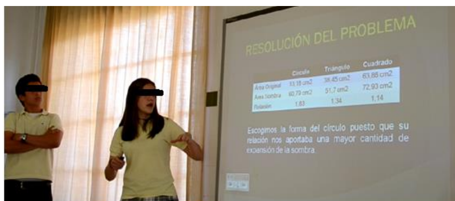
Figura 5. Un momento de la presentación

Cada grupo expuso, con ayuda de diapositivas digitales y durante diez minutos, su trabajo al resto de compañeros (ver Figura 5). Durante esta sesión se plantean preguntas, se intercambian ideas y se establecen debates respecto a los distintos enfoques seguidos en la resolución de las tareas. La finalidad de esta exposición pública es posibilitar la evaluación del trabajo mediante el contraste de opiniones entre iguales, especialmente entre alumnos de distintos grupos que han realizado, de forma independiente, la misma tarea. Esta presentación oral activa la competencia en Comunicar .