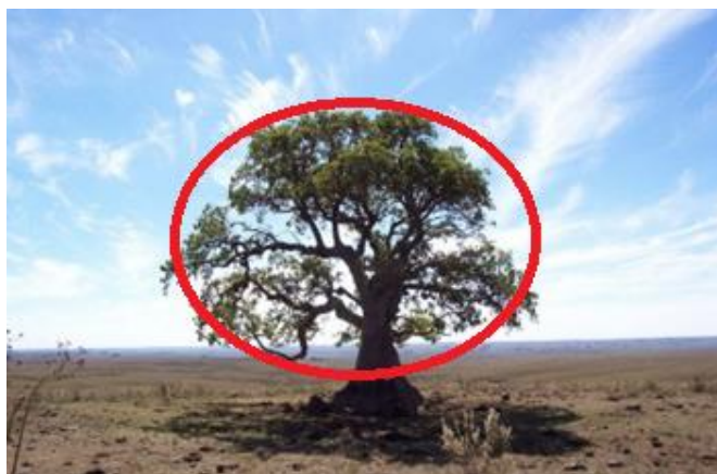
Figura 4. Imagen presentada por los alumnos con el árbol escogido, el Ombú

Los alumnos deben interpretar los resultados recogidos en la Tabla 1 en los términos del problema real que ellos mismos han planteado: la mayor razón se corresponde con la forma geométrica que producirá una mayor superficie de sombra. Llegan por tanto a la conclusión de que deben seleccionar un árbol con una copa circular. El árbol escogido, tras consultar internet, es el ombú, cuya copa, según ellos, se puede ajustar a un círculo (ver Figura 4). Recaban sus dimensiones medias: altura de 10,15 metros y radio de la copa de 4,5 metros. La elección de este árbol se debe únicamente a criterios de gusto personal, y los alumnos no entran en otras consideraciones tales como su adecuación a nuestro clima, su coste, o factor de crecimiento. Obviamente, el hecho de no tener en cuenta otros factores es una simplificación del problema.