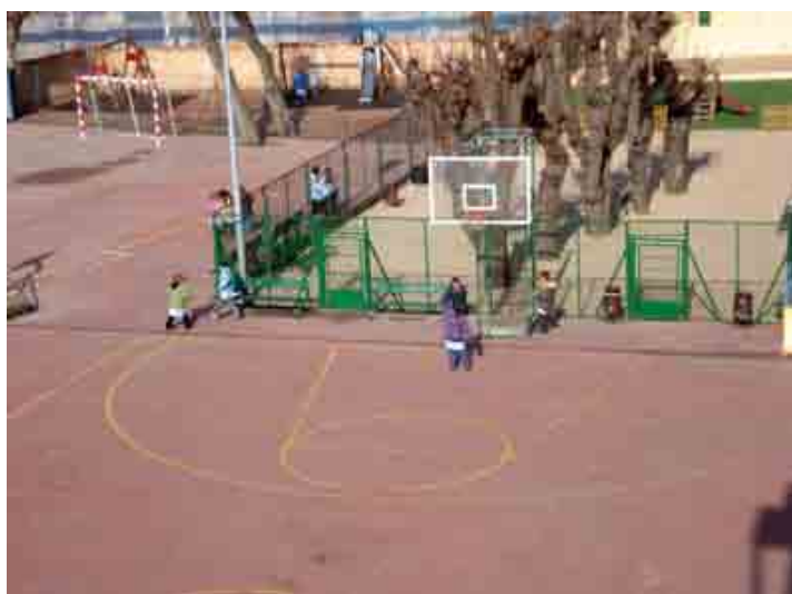
Figura 4. Patio del Colegio Nuestra Señora de Lourdes con alumnado de diferentes cursos.

En la parte exterior del centro educativo está el patio, que es amplio y dispone de dos canchas (polideportiva y de baloncesto), dos parques, jardines y zonas cementadas. El patio está rodeado de edificios y muros: el edificio del colegio y de la residencia de las hermanas (monjas franciscanas); y comparte un muro con el patio de un edificio residencial, y otro con las antiguas vías del tren. El patio es un espacio sin riesgos como el resto del centro educativo, con la diferencia que es descubierto, y por tanto vulnerable al sol, lluvia, nieve y viento.