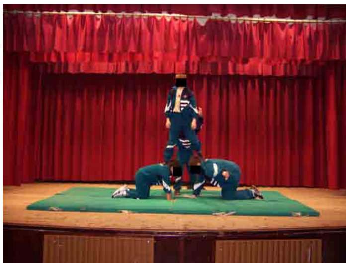
Figura 3. Presentación del “ejercicio estrella”: un grupo presenta la figura acrobática referente a las construcciones con el cuerpo en tríos, en la unidad didáctica “Acrosport”.

En el escenario del salón acontece la actividad “Ejercicio estrella”, y la elaboración y ensayo de la coreografía para el “Playback”, que será presentada en las fiestas del colegio. El escenario está a un metro de altura en relación al suelo del salón, mide aproximadamente cinco por diez metros y tiene el suelo de tarima. El escenario dispone de dos cortinas color vino; de un fonal, que es un tejido vino que va desde el techo hasta el suelo; y delante del fonal, hay tres bambalinas del mismo color, que adornan el escenario. En la presentación del “Ejercicio estrella”, que acontece al final de las sesiones de la unidad didáctica “Acrosport”, el profesor enciende todas las luces del escenario y coloca un foco de luz encima de las colchonetas, sobre las cuales los grupos ejecutan sus figuras acrobáticas. Los espectadores asisten sentados en semicírculo en el suelo del salón (de frente al escenario), mientras un grupo presenta su “ejercicio estrella” en el escenario, y los grupos van rotando.