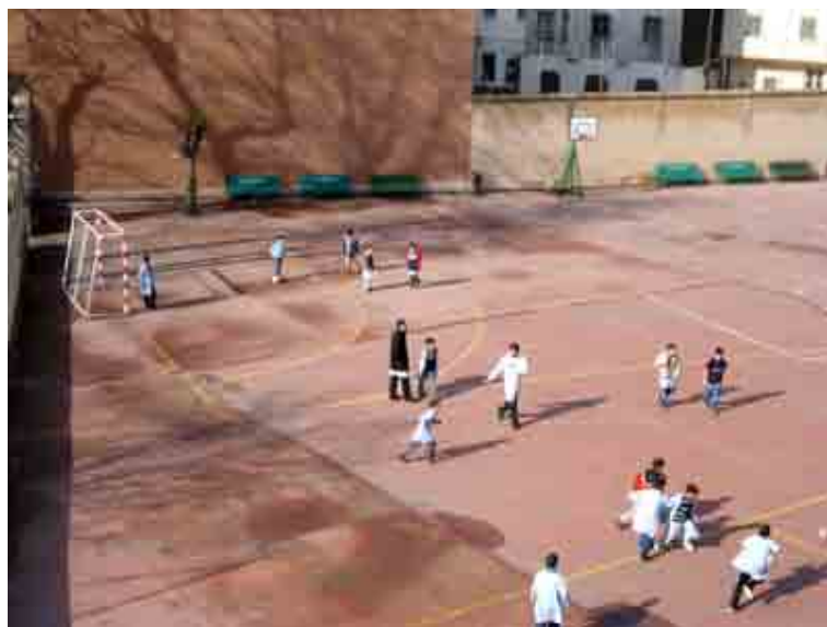
Figura 5. Patio del Colegio Nuestra Señora de Lourdes: alumnado jugando en el recreo.

La cancha polideportiva está en el centro del patio y mide aproximadamente veintiocho por quince metros. La cancha es cementada y tiene el suelo liso, con pequeñas irregularidades por el tiempo de uso. Las líneas de los deportes institucionalizados para las clases de educación física de Primaria son adaptadas a los juegos que allí se realizan. Por ejemplo, en “Polis y cacos” el área de portería del balonmano representa “la casa”, que es el espacio en que los cacos están protegidos de los polis; y en la portería contraria se coloca la cadena de atrapados, simbolizando la cárcel. En “Pepo y Pepito”, “Pañuelo” y “La araña”, son las líneas de ataque del voleibol que ejercen un papel fundamental en las normas de estos juegos.