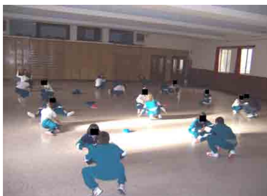
Figura 2. Actividad “Reto libre”: el alumnado con sus correspondientes adversarios realizan diferentes duelos individuales del tema “Me enfrento al rival”.

Para la actividad “Reto libre”, el salón está dividido en dos zonas: la “zona de reto” y la zona de los “rings” (en el salón general). La “zona de reto” mide aproximadamente tres metros cuadrados y está ubicada delante del escenario: en este espacio el alumnado busca una persona para “retar”. La zona de “rings” está compuesta por doce “rings” (cada uno mide aproximadamente dos metros cuadrados), que están delimitados por conos en sus cuatro esquinas. Los “rings” están dispuestos en cuatro filas con tres “rings”, y son numerados desde el uno hasta el doce: el uno es el que está al fondo del salón del lado contrario a la puerta, y el doce el que está en frente del escenario del lado opuesto. En el fondo y laterales del salón, hay un espacio para que el alumnado se desplace desde la zona de reto hacia el “ring” que está disponible.