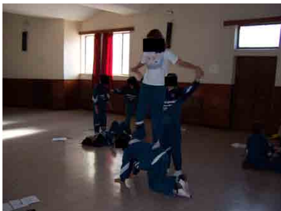
Figura 1. Figuras acrobáticas en tríos: los grupos realizan las figuras del Acrosport en el salón del colegio.

fondo del salón hay dos espalderas de madera, que no son utilizadas en las tareas motrices de educación física. En el techo, hay varias columnas paralelas al suelo, que son notadas por el alumnado en el juego “Balón torre”, ya que en ocasiones el balón golpea las columnas porque éstas están perpendiculares al terreno del “jugador torre”, es decir, dónde hay que hacer llegar el balón para marcar un punto.