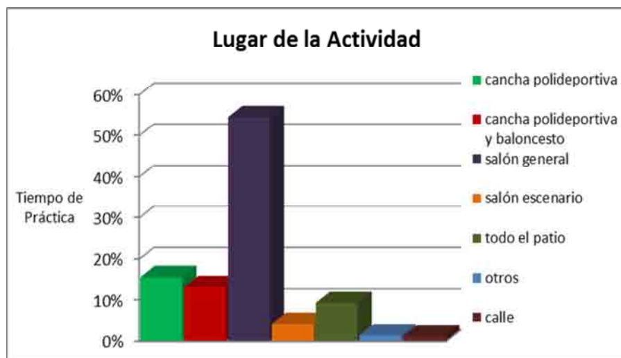
Figura 6. Los lugares para educación física en función del tiempo total de práctica motriz: cada columna representa los diferentes lugares en los que acontecen las situaciones motrices en educación física.

A continuación, presentamos el gráfico con los resultados obtenidos en el análisis estadístico, que corresponden al porcentaje del tiempo total de práctica motriz de la educación física. En ello, se puede observar la proporción del uso de los diferentes lugares para las actividades motrices propuestas en el curso lectivo.