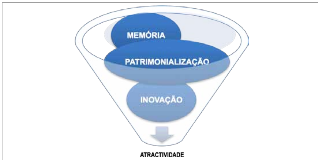
Figura IV. Esquema da Atractividade Cultural

recursos, de bens e indústrias culturais), quer como indutor de outros factores, igualmente intangíveis, criadores de bem-estar social, progresso cultural e prosperidade económica. Parte do pressuposto que o património e as indústrias criativas, bem para além da simples criatividade associada à gestão de ideias, geram condições internas e externas positivas que se estendem da patrimonialização da memória à promoção da noção de inovação e atractividade cultural: