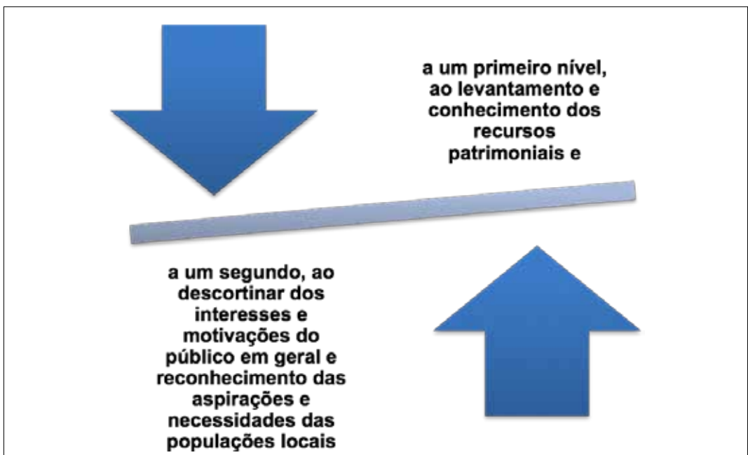
Figura VI – Balanço dos Recursos Endógenos [Recursos Patrimoniais e Motivações Locais]

Como se depreende do exposto anteriormente, o investimento no património obriga sobretudo ao assumir de uma política integrada, isto é, de articulação de políticas centrais ou locais com as políticas sectoriais. Esta possibilidade implica, por sua vez, posições simétricas de âmbito regional e local de valorização cultural do património (centros históricos, bairros culturais, museus de território ou ecomuseus, ruínas legíveis, paisagens interpretadas, etc.), fortalecendo quer a sua relação com o território, quer associando uma oferta turística (produto cultural) diversificada, assente em redes (de equipamentos), eventos culturais regulares e projectos de itinerância. Um programa de acção desta natureza obriga a dois níveis de equilíbrio estabelecendo o balanço dos recursos endógenos: