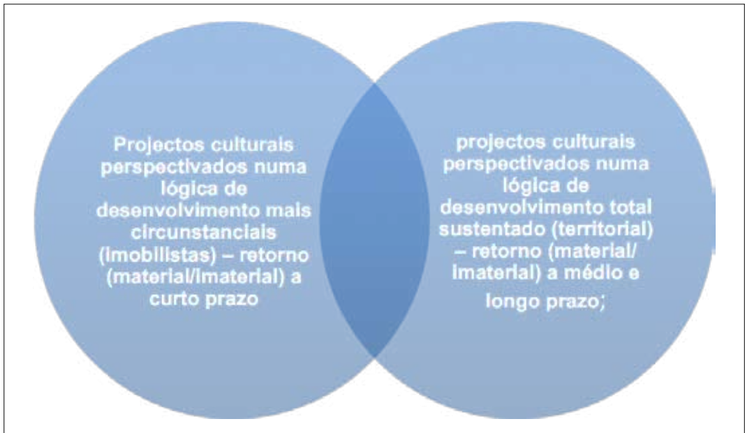
Figura V. Desenvolvimento Circunstancial vs Desenvolvimento Sustentado