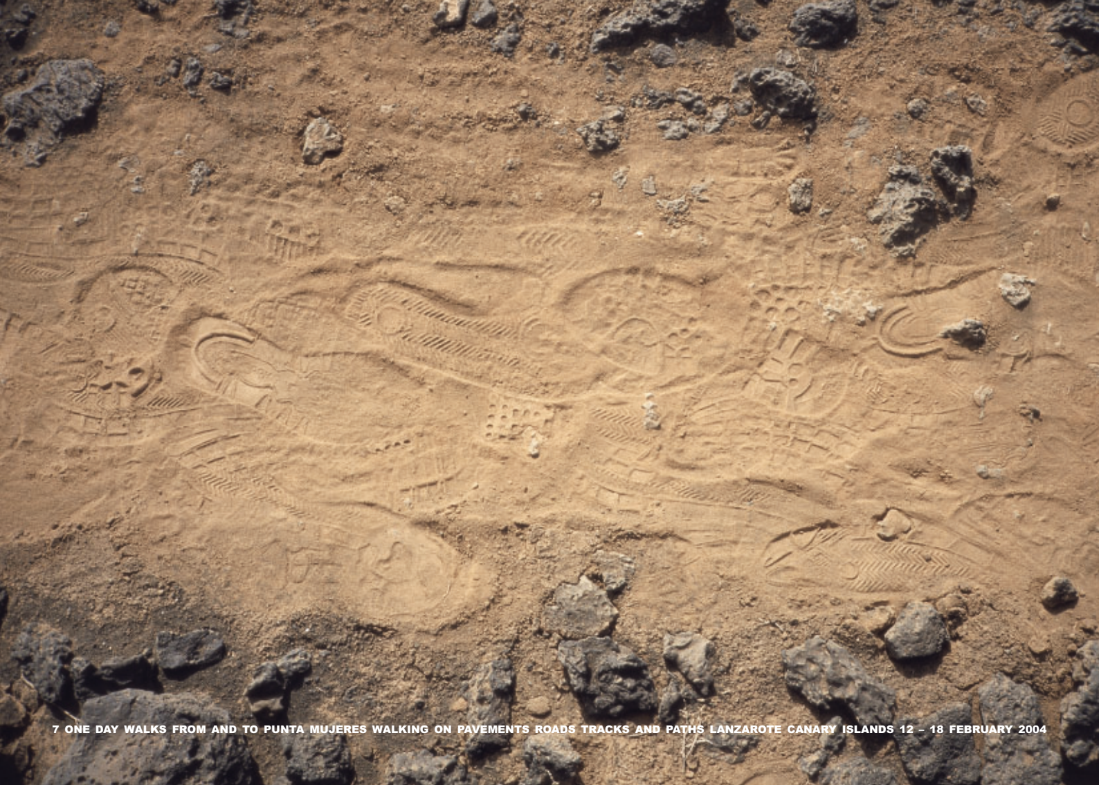
7 ONE DAY WALKS FROM AND TO PUNTA MUJERES WALKING ON PAVEMENTS ROADS TRACKS AND PATHS LANZAROTE CANARY ISLANDS 12 - 18 FEBRUARY 2004