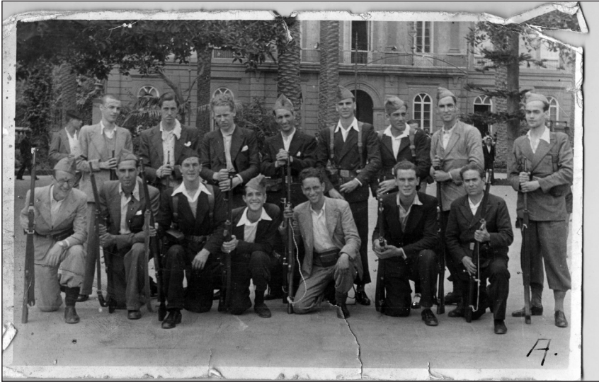
Civiles armados frente al Gobierno Militar. Parque de San Telmo, Las Palmas de Gran Canaria. 18 de julio de 1936. Foto señalada como A.