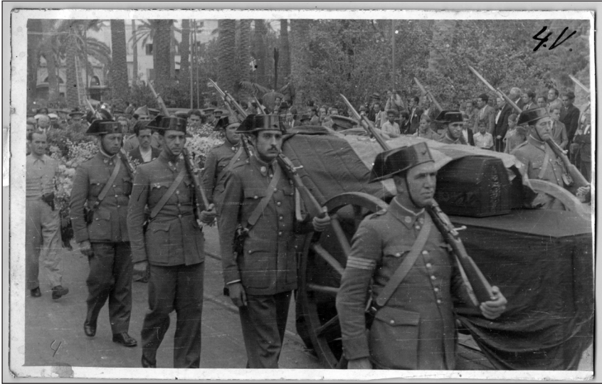
Entierro de dos militares. 21 de julio de 1936. Foto señalada como 4 V.

1918 y estuvo en el denominado «Batallón de Arucas» 17 . Fue movilizado en 1936, embarcó hacia Galicia y permaneció en el ejército hasta 1940. Luchó en los frentes de Jaca, Belchite, Teruel 18 , El Ebro, etc. Desfiló en Madrid en el denominado Desfile de la Victoria , que tuvo lugar el día 19 de mayo de 1939.