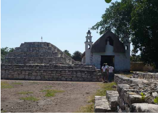
Figura 12. La capilla de la Virgen de Xcambó y el Cerro de la Virgen.