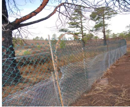
Imagen 9. Detalle del vallado donde se puede observar dos tipos de luz de malla para evitar el acceso de los conejos.

Con ello se pretende obtener información sobre el comportamiento del hábitat sin la presencia de herbívoros alóctonos, hecho que nos permitirá cuantificar el impacto de los mismos.