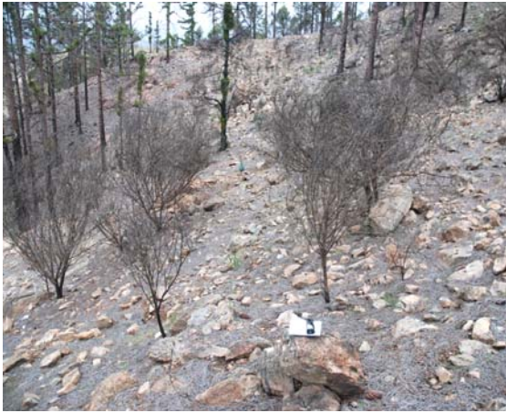
Imagen 2. Efecto del fuego en el sotobosque (año 2009).