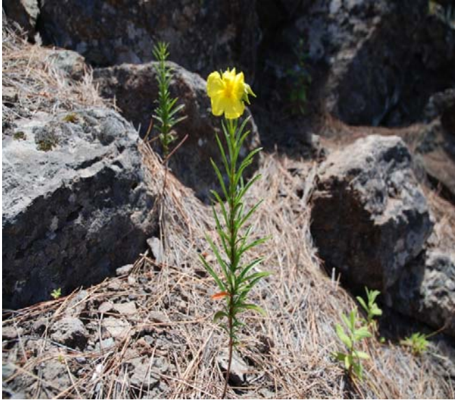
Imagen 1. Plántulas de la jarilla de Inagua ( Helianthemum inaguae ) naciendo fuera de los refugios conocidos antes del incendio. Las mismas han sobrevivido a la presión de las cabras gracias a los vallados de protección llevados a cabo en el ámbito del proyecto LIFE+ Inagua.

De esta forma se aumentan las probabilidades de extinción de estas especies amenazadas ya que el reducido tamaño de su población las hace muy vulnerables.