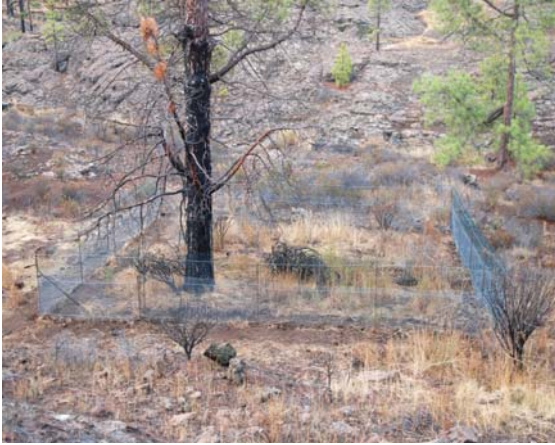
Imagen 8. Vista general de uno de los vallados de exclusión.