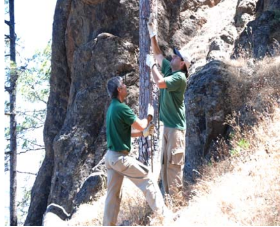
Imagen 5. Trabajando en los vallados.