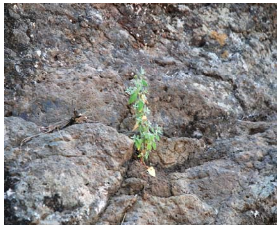
Imagen 7. Plántulas del turmero peludo ( Helianthemum bystropogophyllum ) que han sobrevivido al ramoneo de las cabras gracias a los vallados.

Por otro lado, se ha realizado un seguimiento de las poblaciones, tanto de la recuperación de los individuos adultos después del fuego como de la regeneración natural de las mismas. Se ha realizado el seguimiento de las poblaciones de la jarilla de Inagua ( Helianthemum inaguae ), el turmero peludo ( Helianthemum bystropogophyllum ), la cresta de gallo ( Isoplexis isabeliana ), el rosalillo ( Dendriopoterium pulidoi ), la siempreviva de Amargo ( Limonium sventenii ), la retama