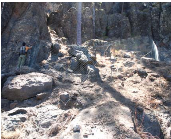
Imagen 6. Vista general de uno de los vallados ya instalados.