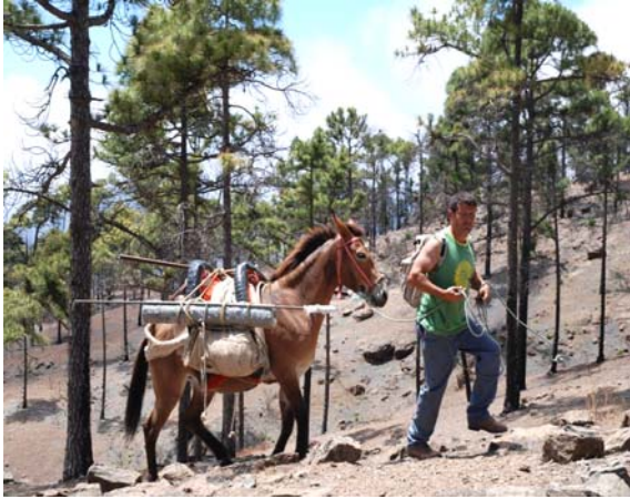
Imagen 4. Transporte de materiales con animales de carga.

supervivencia de individuos nacidos en la presente anualidad, con lo que se espera que en los próximos años se aumente de forma significativa las poblaciones de dichas especies.