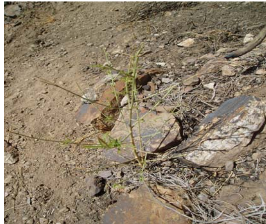
Imagen 3. Plántulas de escobón afectadas por ramoneo.

Por otro lado, el sotobosque juega un papel fundamental para el pinzón azul de Gran Canaria ya que le permite protegerse de sus predadores, así como proporciona un lugar de alimentación. La eliminación del mismo por efecto del fuego hace que los individuos se encuentren desprotegidos ante los predadores cuando se acercan a beber a los puntos de agua o se alimentan. Al ralentizarse los procesos de recuperación del sotobosque se aumenta el tiempo de desprotección de los pinzones, hecho que unido al efecto que tuvo el fuego sobre sus poblaciones, dificultan su recuperación.