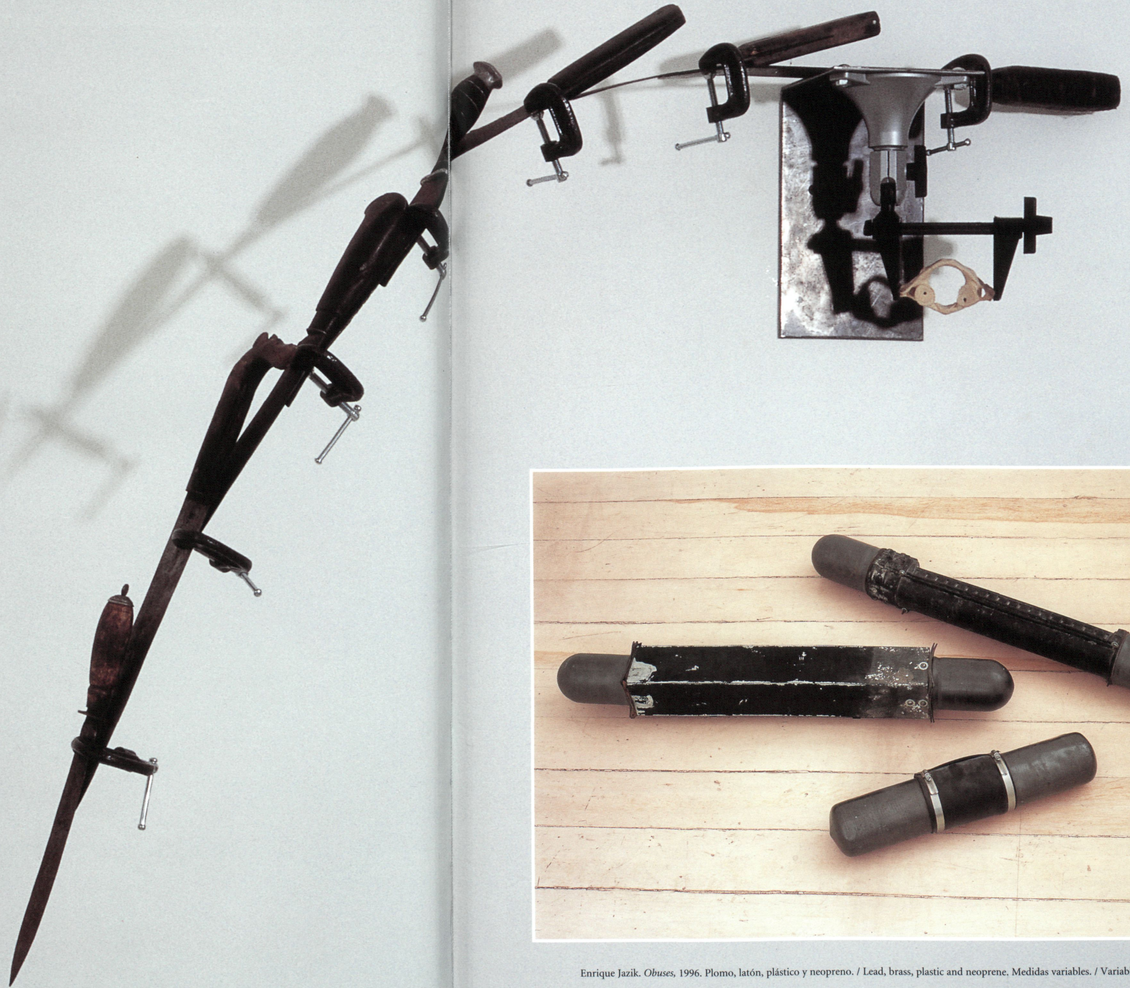
Enrique Jazik. Obuses , 1996. Plomo, latón, plástico y neopreno. / Lead, brass, plastic and neoprene. Medidas variables. / Variable dimensions.