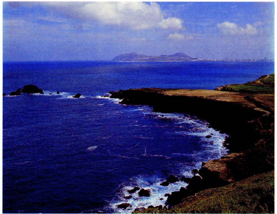
La Punta de Arucas

• Estructurando y regenerando el espacio consolidado en Playa del Inglés—Maspalomas, mediante acciones infraestructurales y dotacionales, entre las que destacan: la remodelación de los accesos desde la nueva autovía, ordenar la nueva fachada urbana en la zona intersticial inmediata a ésta, reconvertir la carretera C—812 en Avenida Urbana, reurbanizar la Avenida de Iirajana, renovar el alojamiento turístico de baja calidad en zonas no colma-