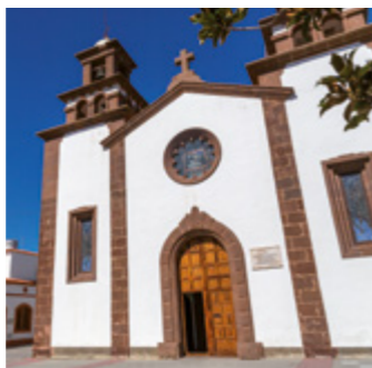
Iglesia de San Matías.