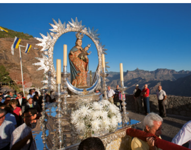
Virgen de la Cueva.

Desde comienzos del siglo XVIII se celebra esta fiesta el 14 de septiembre en el barrio de Acusa, congregando a numerosos romeros que acuden a cumplir sus promesas. Y por último, pero no menos importante, es la Candelaria de Acusa. Se celebra el segundo domingo de octubre, devoción arraigada desde el siglo XVII.