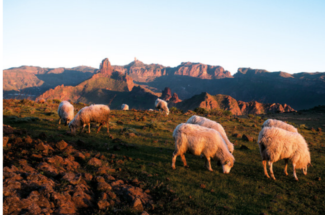
Llano de Acusa Verde con los Roque de Bentayga y Nublo al fondo.