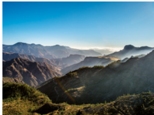
Vista Parque Natural de Tamadaba.

Saliendo de la Iglesia podemos subir unos 400m hasta llegar a la Ermita de La Cuevita . Por el camino observamos una vista panorámica del Roque Bentayga y Roque Nublo . Al llegar a la ermita lo primero que nos llama la atención es que el altar, el púlpito, el confesionario y el coro están tallados en la roca misma. En esta gruta se venera a la Virgen de La Cuevita, escultura en madera de 0,80m de alto y