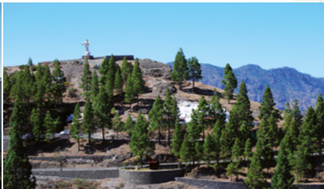
Escultura del Sagrado Corazón de Jesús.

Siguiendo por la calle hacia la Iglesia nos encontramos con El Balcón de Unamuno y el Mirador de la Esquina . El Balcón de Unamuno fue construido en 1999 para conmemorar la estancia del ilustre escritor y filósofo español en 1910. Desde estos lugares estratégicos podemos contemplar la impresionante Caldera de Tejada, atravesada por barrancos y en cuya parte