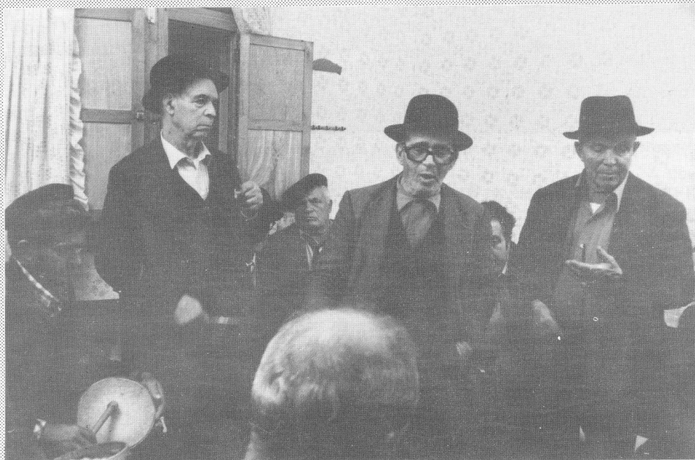
Rancho de ánimas en la salida a Pino Santo, febrero de 1984.

La rueda que forma el Rancho, de esta manera, se expande hacia cuantos están presentes y se multiplica a los