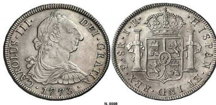
Fig. 2. Moneda de Carlos III acuñada en la ceca de Potosí (1773).