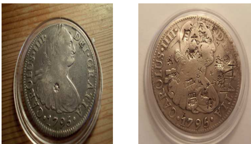
Fig. 3. Modelos de resellos.

Los reales de a ocho comenzaron a perder su hegemonía a partir de 1732, cuando fue sustituido por el peso de cordoncillo con una pureza inferior, disminuyendo la misma 1772, mientras el oro brasileño comenzó a inundar los mercados 7 .