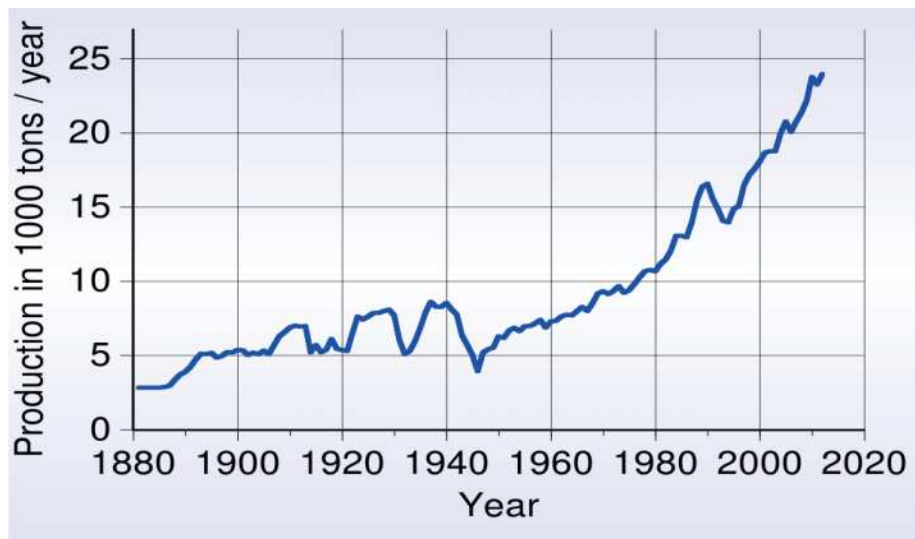
Gráfico 2. Tendencias de la producción mundial de plata (1880-2020).

Fuente: Nacional Mineral Information Center.