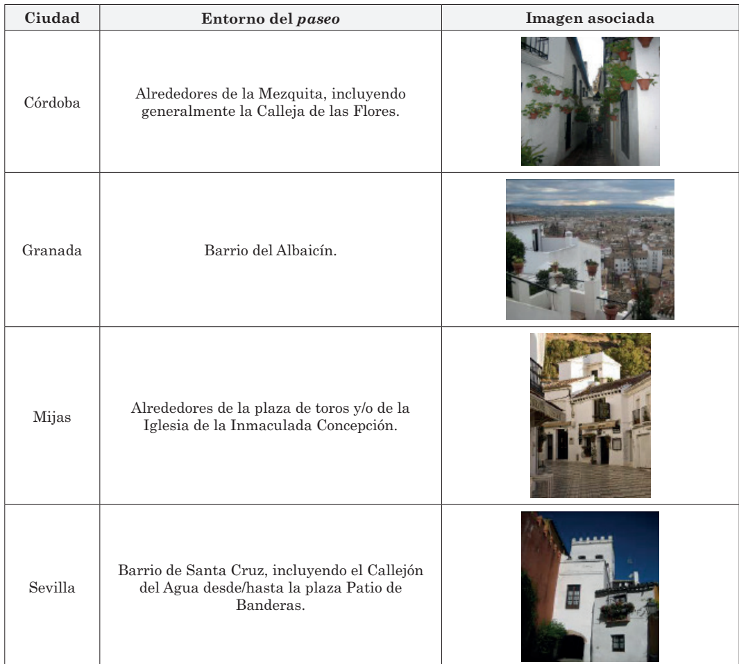
Tabla 1: Entornos donde se realizan los paseos de los grupos de turistas japoneses en diferentes ciudades andaluzas.