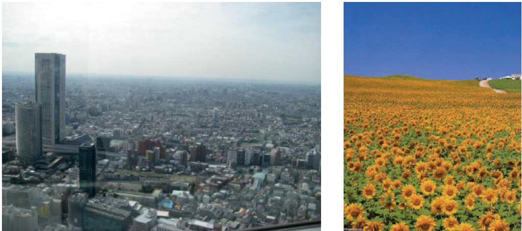
Imagen 1: Oposición entre la imagen urbana de Japón, a la izquierda (Tokyo, fotografía propia, marzo 2009) y, a la derecha, el paisaje de girasoles que compone una de las imágenes genéricas sobre España hoy día

Fuente: folleto turístico “España. Portugal. Isla de Mallorca.”; 2008:1.