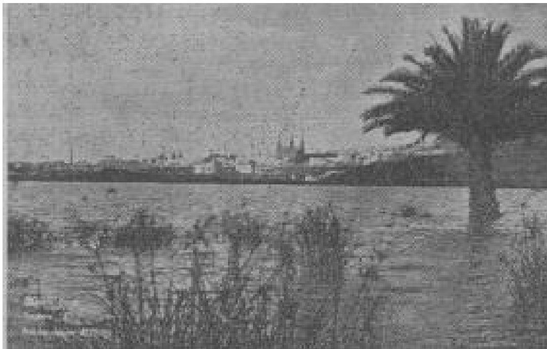
Figura 5. Inundación de Las Vegas en el año 1950.

Asimismo, durante el período que abarca desde 1951 hasta 1989, las máximas precipitaciones que se han registrado en 24 horas en Arucas tuvieron lugar el 24 de octubre de 1955, fecha en la que se recogieron 190 mm. en un día (según el contenido ambiental de la Revisión de las NNSS). Unos años antes, en 1950 (según se documenta en el número correspondiente a junio de 1950 de la Revista Arucas ), las lluvias acecidas durante ese invierno anegaron una gran parte de Las Vegas, lo que dio lugar a la formación de una pequeña laguna (ver figura 5).