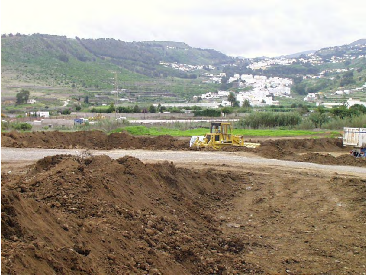
Foto 6. Ejecución de diversas obras en Las Vegas (2004).

infraestructuras viarias (como la autovía de circunvalación de Arucas a Firgas y su conexión con la autovía de circunvalación de Las Palmas de Gran Canaria, GC-3), con la instalación de un gran espacio libre, en el que se tiene previsto desarrollar parques, jardines, lugares de ocio, etc., así como la ampliación de la carretera GC-43 (Arucas-Teror), con la creación de una vía peatonal y zonas ajardinadas (conocida popularmente como “Kilómetro 1”) y, por último, la ampliación, también urbanística, de la zona de Visvique hacia una parte de Las Vegas.