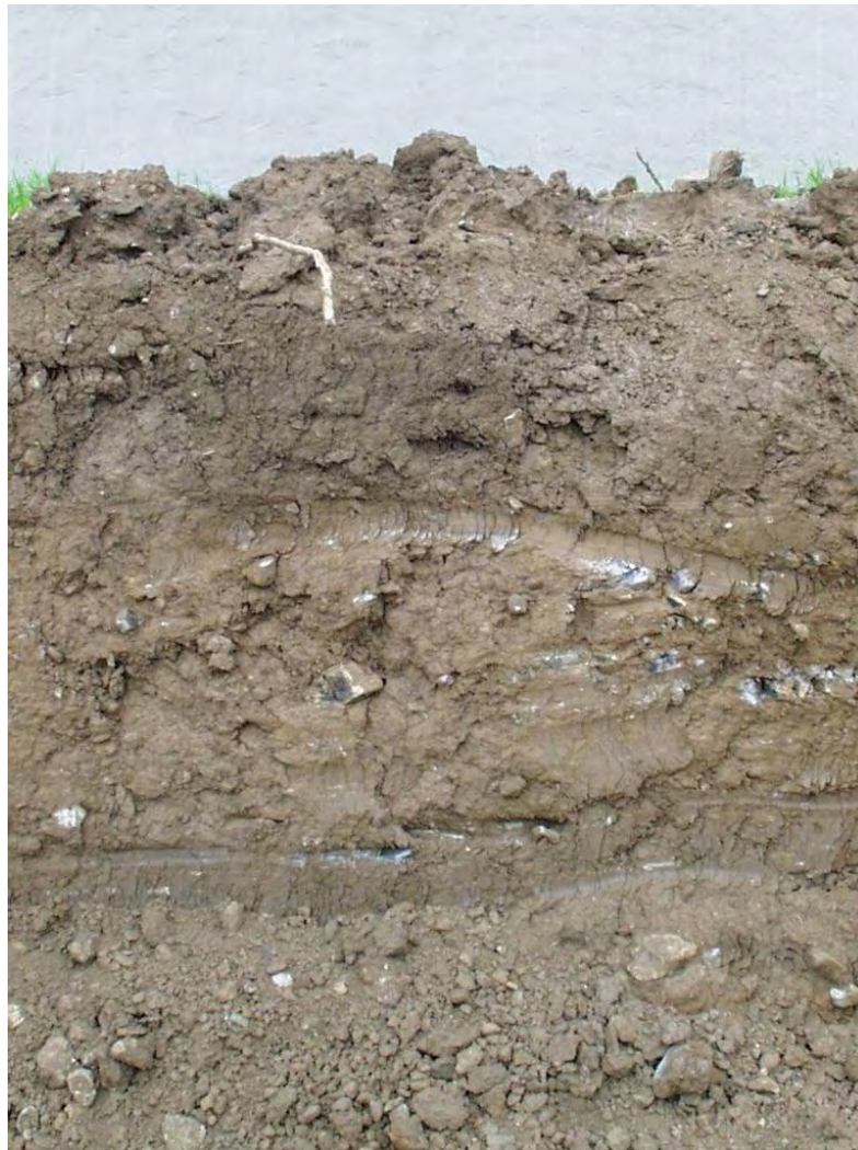
Figura 3. Detalle de un perfil de Las Vegas, en el que se puede observar la presencia de tierra arcillosa (2004).

En cuanto al tipo de suelo que se establece en el área que ocuparía la Laguna, éste se caracteriza (según el mapa de características edáficas del contenido ambiental del documento de la Revisión de las Normas Subsidiarias de Planeamiento Municipal, en adelante NNSS) por ser del tipo Chromoxerert. A este tipo pertenecen los mejores suelos agrícolas, no sólo de Arucas, sino también de la isla. Estos suelos agrícolas se concentran, además de en la zona de Las Vegas de Arucas, en Trasmontaña, Bañaderos, Las Hoyas, Hoya de San Juan, etc. La mayor parte de estos suelos se han formado a raíz de tierras de arrimo o de préstamo que se formaron con los procesos de sorribas agrícolas generadas a finales del siglo XIX, pero sobre todo a comienzos y mediados del siglo XX. Sin embargo, en el caso de Las Vegas, se plantea que es un tipo de suelo original, de textura arenosa perteneciente al Orden Vertisol y al Suborden Xerert (ver figura 3), con una capacidad de uso elevada (clase B), susceptible de utilización agrícola moderadamente intensiva, así como de otras utilidades presentando limitaciones y riesgos de erosión escasos (J. Sánchez Díaz, 1975).