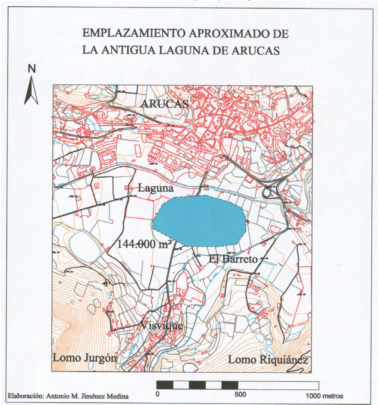
Figura 4. Plano de propuesta de ocupación de superficie de la Laguna de Arucas. Elaboración: A. Jiménez Medina.

barranquillos confluyen; tales son los casos del Barranco de Arucas, el barranquillo de La Calva, y el barranquillo de La Zanja. En relación a estos cauces y a los manantiales, éstos todavía proporcionaban aportes hídricos a mediados del siglo XIX a la vega agrícola, tal y como lo recogía en su diccionario geográfico, estadístico e histórico, Pascual Madoz ([1850] 1986, p. 46).