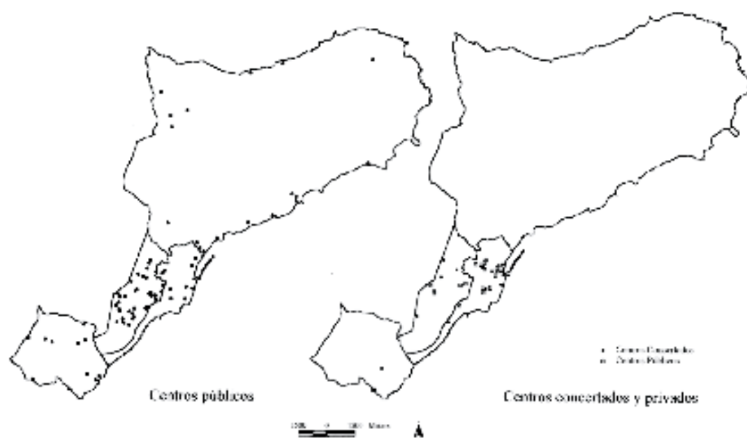
Figura 2. Equipamientos educativos según titularidad