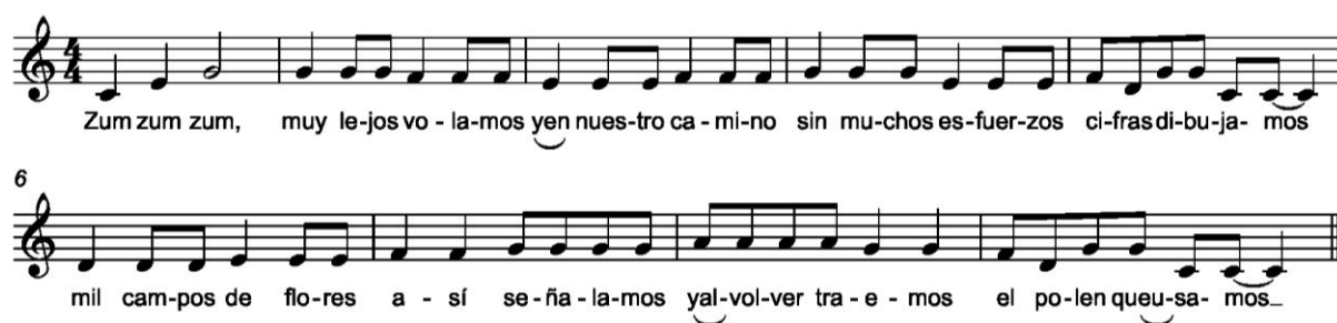
Figura 11. La danza de las abejas . Canción compuesta por el Grupo D. Letra tomada de los capítulos 8 y 9

Melódicamente utilizan un ámbito reducido, Sol3 a Do4, pero con un muy interesante elemento melódico sobre el VII grado que han rebajado, de forma intuitiva, medio tono, Sib, lo que, sin salir de Do Mayor, produce un efecto relajante y misterioso en la melodía.