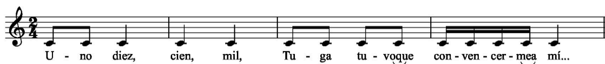
Figura 7. Variación rítmica, por reducción, del mismo verso representado en la figura 6

Pero no es el único ejemplo. Se pueden obtener muchos más modelos rítmicos a partir de esta misma letra.