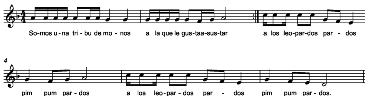
Figura 12. Somos una tribu de monos . Canción compuesta por el Grupo E. Letra tomada de los capítulos 10 y 11

En el compás 6 se nota un desarrollo melódico en forma de escala ascendente, que crea una tensión armónica hasta el VI grado que resuelven de forma sencilla y directa con V-I. La melodía de esta canción se mueve en su práctica totalidad por grados conjuntos, lo que facilita la entonación y aprendizaje de la escala de Do Mayor a unos alumnos de los primeros cursos de Primaria.