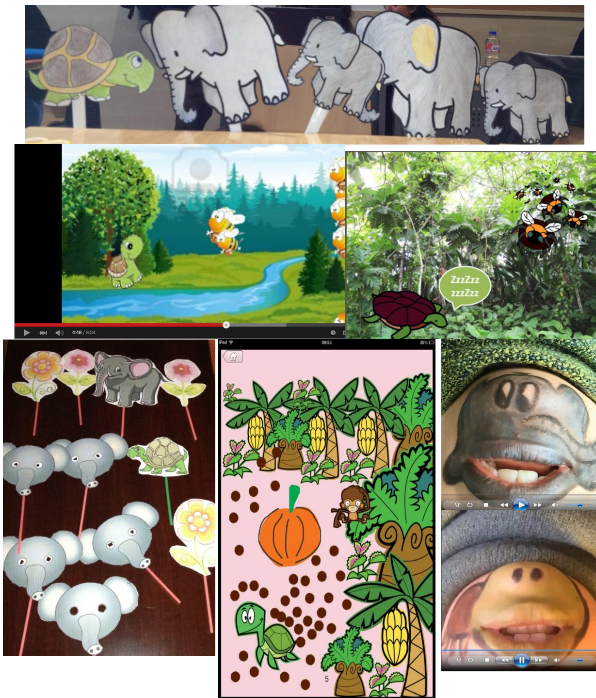
Figura 2. Montaje de distintas escenas de la representación del libro empleando diferentes técnicas