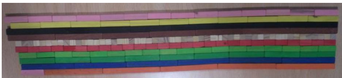
Figura 3. Muro de regletas con base 54 para trabajar contenidos matemáticos del capítulo 14

En segundo lugar se debe elegir entre incluir una actividad relacionada con el área de Lengua Castellana y literatura o con el área de Conocimiento del Medio. El planteamiento es análogo al explicado en el apartado anterior pero en relación con los contenidos de los capítulos, los alumnos debían focalizar la atención en una actividad de alguna de las dos áreas señaladas. La Tabla 6 muestra las propuestas realizadas por los alumnos.