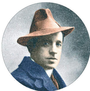
Retrato de Francisco Villaespesa.

Sobre la vida y obra de Francisco Villaespesa, se puede consultar en el Archivo-Biblioteca de la Casa-Museo Tomás Morales una gran variedad de bibliografía, entre la que destacamos las ediciones ilustradas por José Moya del Pino (1891-1969): Jardines de plata: poesías (1912), El balcón de Verona (1912), Era él: poema en un acto y en verso (1913), Lámparas votivas: poesías (1913), Las pupilas de Al-Motadid (1915), Los paneles de oro: poesías (1912), entre otras muchas. También en el epistolario de Tomás Morales se puede consultar una carta que Francisco Villaespesa le envía a Tomás Morales desde La Habana en 1919, así como varias referencias a él de otros destinatarios.