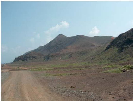
20. La Atalaya de la Isleta, vista desde la parte trasera de Las Coloradas, desde donde se «atalayaba» la llegada de barcos a la isla.