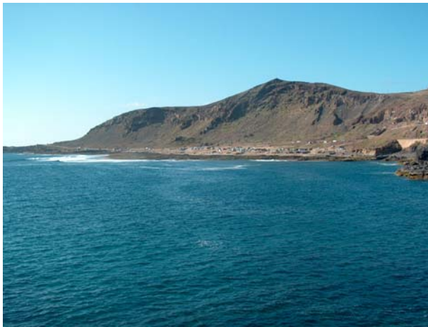
14. Zona actual de El Confital, espacio natural protegido.