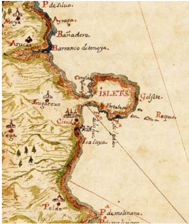
13. En los mapas y textos antiguos aparece siempre la denominación Isletas , en plural, seguramente para responder a la pluralidad de montañas que en ella se advierten (dibujo de P.A. del Castillo, 1686).