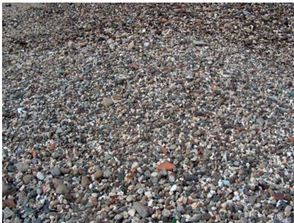
15. Confital se llamó a la parte noroeste de las Isletas por las piedrecitas blancas, como confites, que se formaban en el límite de la playa.