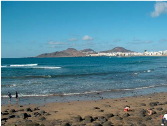
19. Las tres «montañas» principales de la Isleta, desde el extremo oeste de la playa de Las Canteras (foto del autor).