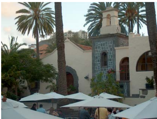
12. A Santa Catalina se dedicó la primera ermita de expansión del barrio fundacional de la ciudad y actualmente el parque principal de la zona del Puerto (en la actualidad dentro del Pueblo Canario de Las Palmas).