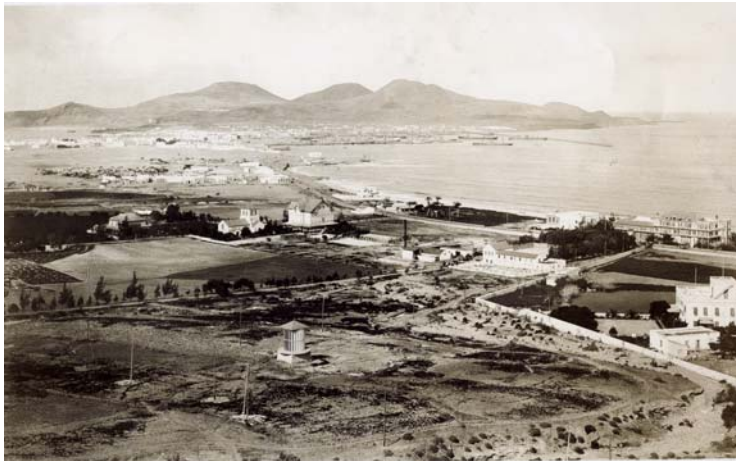
17. Arenales se llamó a la parte intermedia entre la ciudad histórica y el puerto, en exacta correspondencia con la naturaleza de sus suelos (foto de las primeras décadas del siglo XX).