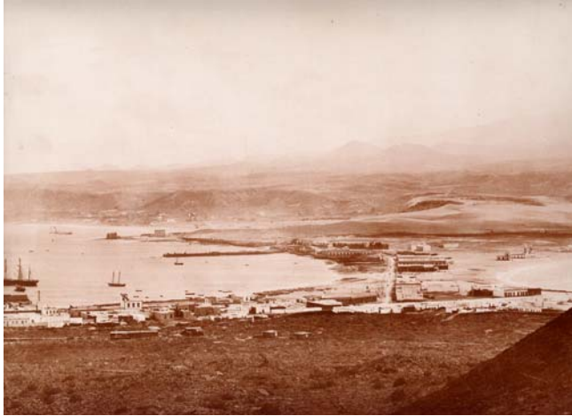
16. El estrecho istmo de arena que unía la isleta con el resto de la ciudad (foto de finales del siglo XIX).