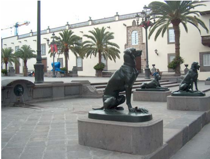
10. La plaza de Santa Ana ha sido desde siempre «la plaza mayor» de la ciudad de Las Palmas.