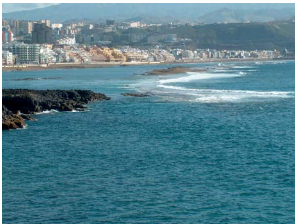
18. Playa del Arrecife se llamó al principio a la playa de las Canteras. La actual denominación de debe a la función de «cantera» que tuvo la conocida popularmente como «la barra» de donde se extraían los bloques de piedra para formar las «pilas de agua».