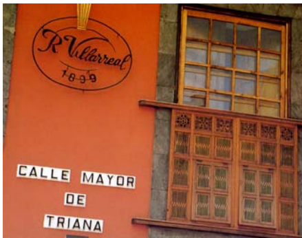
11. Triana se llamó al barrio de expansión de Las Palmas, a imitación del barrio sevillano, y Triana se llama «la calle mayor» de la ciudad.