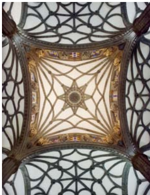
21. La ciudad de Las Palmas tiene tal patrimonio histórico y monumental que bien merece el reconocimiento y el título de «Patrimonio de la Humanidad» (cúpula del cimborrio de la catedral de Las Palmas).