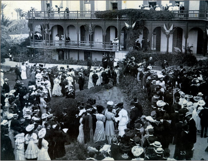
Recepción británica al rey Alfonso XIII en Hotel Santa Catalina.

infraestructuras, como en el caso de Las Palmas Gran Canaria con la construcción de un magnífico puerto en la bahía de Las Isletas; por otro lado, la creciente expansión y capacidad que se da en los medios de comunicación (telégrafo y teléfono) y de información (prensa ilustrada, mayores tiradas de los periódicos con mayor difusión y aumento de lectores) hacen que la percepción de los territorios del reino sea más cercana y el monarca debe estar también más próxima de ellos; de hecho, Alfonso XIII decidió que visitaría todas las provincias españolas, incluidas Canarias, Ceuta y Melilla, antes de su matrimonio en mayo de ese año.