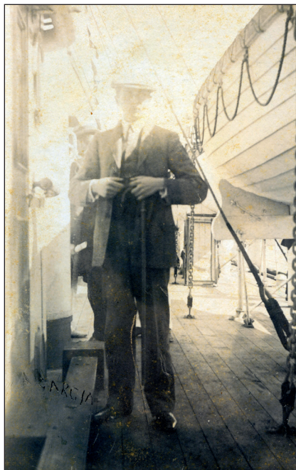
El príncipe Leopold Mountbatten en Gran Canaria.

de una temporada en esta isla. En este viaje el príncipe ocupó el camarote del capitán. Ya en el puerto de La Luz, donde entró todo empavesado de banderas, como correspondía a la ocasión, fondeó en la bocana del puerto interior, junto al crucero británico Isis , del francés Agere y de la fragata de guerra alemana Take .