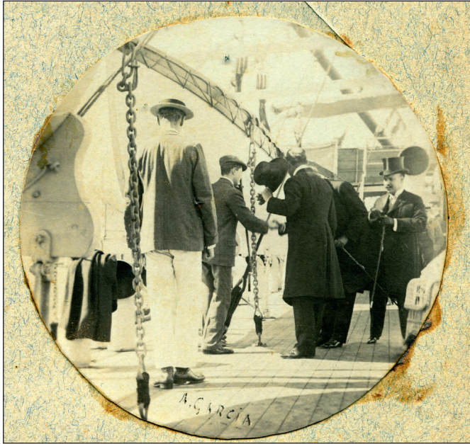
El príncipe Leopold Mountbatten recibe abordo a autoridades grancanarias.