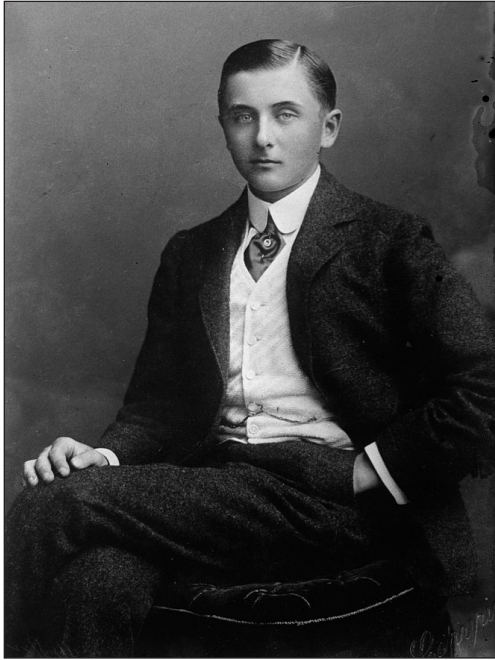
El príncipe Leopold Mountbatten en Gran Canaria.