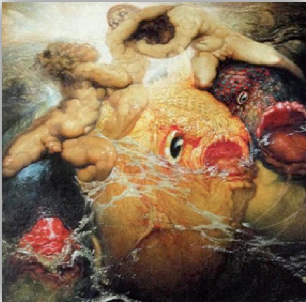
Ilustración 2. El Amanecer . Óleo sobre lienzo 126 x 126 cm. (1912-1913). Fondos Museo Néstor.

270. Serie Fauna . 12 x 17 cm. Tinta sobre papel. s/f. Este rascacio está trabajado en su totalidad; el artista ha sabido captar el movimiento, es decir, no permanece estático. Se encuentra en relación directa con el Poema del Atlántico pues ésta misma figura aparece representada en el lienzo de La Tarde . Aparece una nota escrita por Néstor en la parte izquierda de la lámina “Reducir a 0,4 de altura”. El número “4” se encuentra remarcado, como si Néstor hubiese dudado sobre la medida que debía utilizar. Además el pintor anotó un tres bajo la cabeza del pez. No está firmado por el autor. El rascacio es frecuente en fondos rocosos, y es conocido únicamente en Canarias, Madeira y Azores, en los fondos pertenecientes a la Macaronesia.