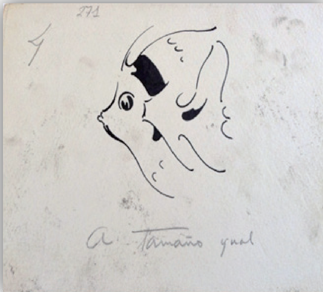
Ilustración 5. Serie Fauna Fondos Museo Néstor.