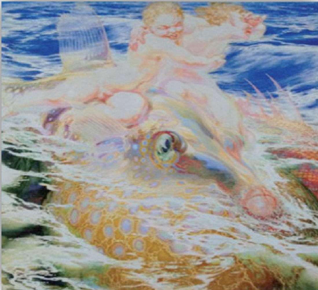
Ilustración 14. El Mediodía . Óleo sobre lienzo 126 x 126 cm. (1917-1918). Fondos Museo Néstor.