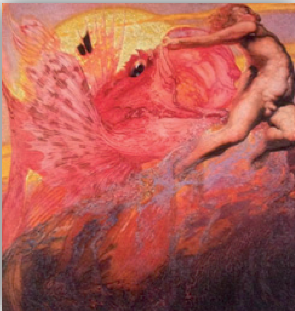
Ilustración 4. La Tarde. Óleo sobre lienzo 126 x 126 cm. (1917-1918). Fondos Museo Néstor.