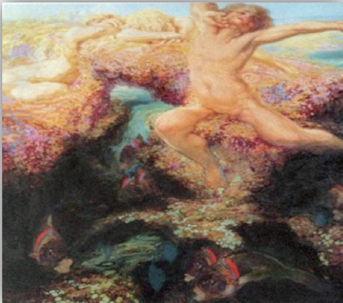
Ilustración 6. El Mediodía . Óleo sobre lienzo 126 x 126 cm. (1921-1923). Fondos Museo Néstor.

304. Serie Fauna . 12 x 17'5 cm. Grafito sobre papel. s/f. Cabeza de morena a lápiz, coloreada en tonos azules y rojos. La cabeza tiene muchos detalles, y se nota que ha sido muy trabajada. Se relaciona de manera directa con El Poema del Mar , más concretamente con La Noche . Esta morena aparece en lado izquierdo del cuadro y es uno de los pocos bocetos que son prácticamente iguales al resultado que mostró el artista en la obra final. No aparece la firma del pintor. La morena puede tener una longitud de hasta 100 cm y su hábitat natural es el fondo rocoso, ocupando normalmente agujeros y grietas, saliendo de estas en horas nocturnas. Quizás por ello es elegida por el artista para aparecer en su lienzo La Noche . Su característica principal es la silueta serpenteante y su color oscuro.