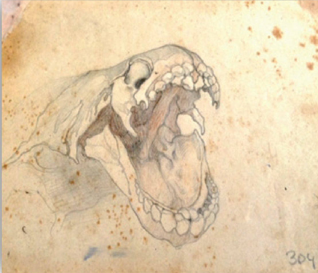
Ilustración 7. 304. Serie Fauna Fondos Museo Néstor.