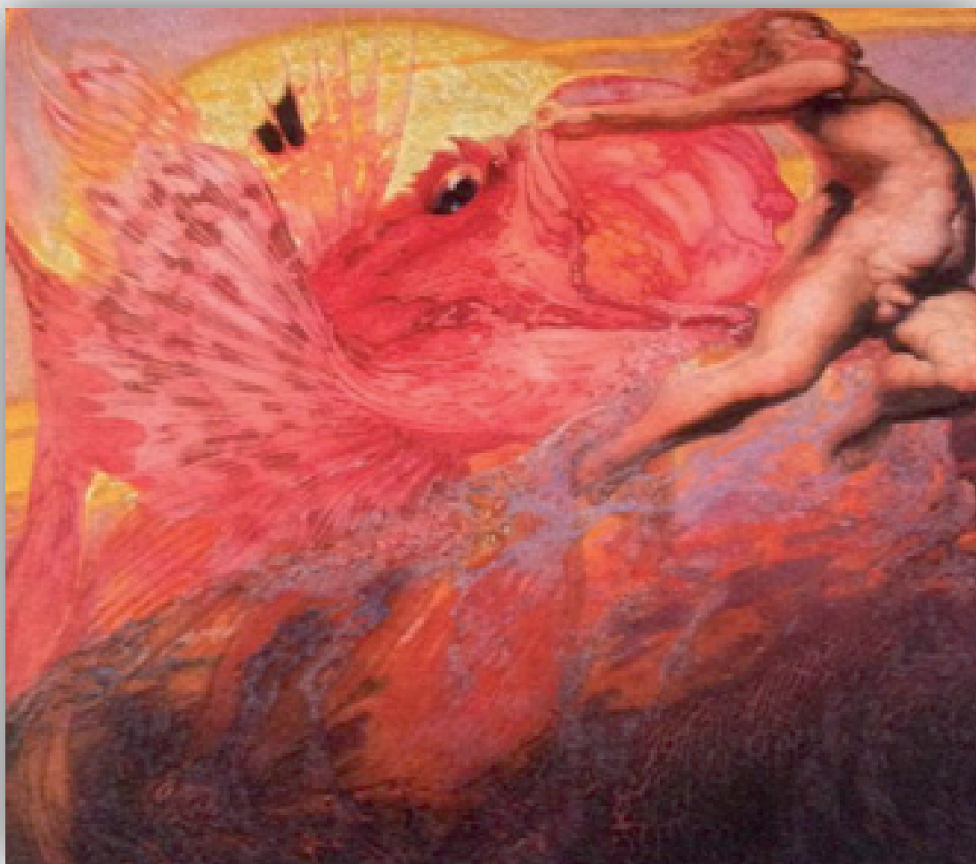
Ilustración 12. La Tarde. Óleo sobre lienzo 126 x 126 cm. (1917-1918).

767. 23 x 32 cm. Grafito sobre papel. s/f. El boceto no destaca por la calidad de dibujo que caracteriza a Néstor. El pez es muy sencillo y al dibujar a los niños el artista sobrepone unas líneas sobre otras quedando una composición poco clara. Está estrechamente relacionado con el Poema del Atlántico , concretamente con el lienzo El Mediodía . No aparece firmado.