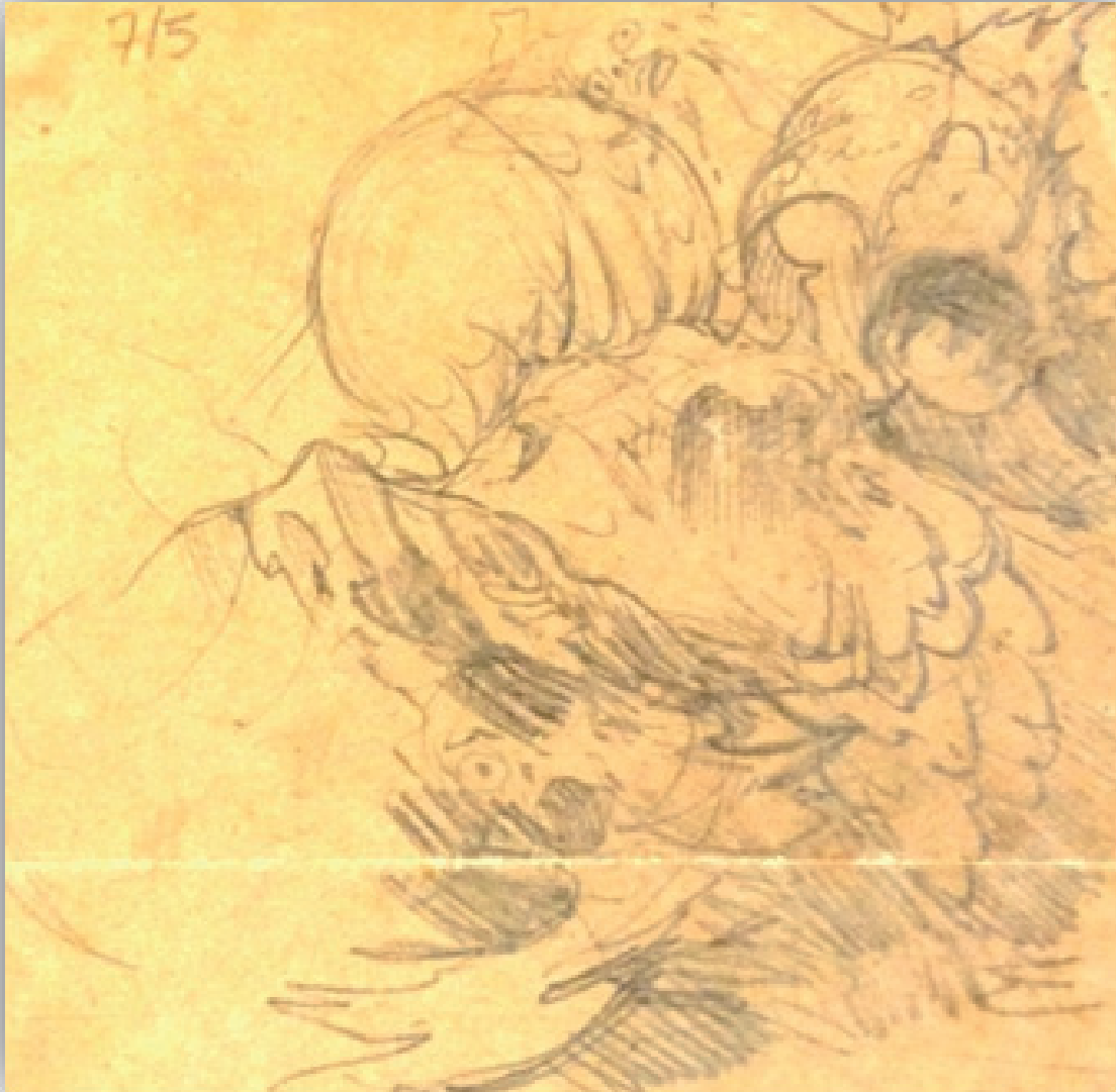
Ilustración 9. 715 Fondos Museo Néstor