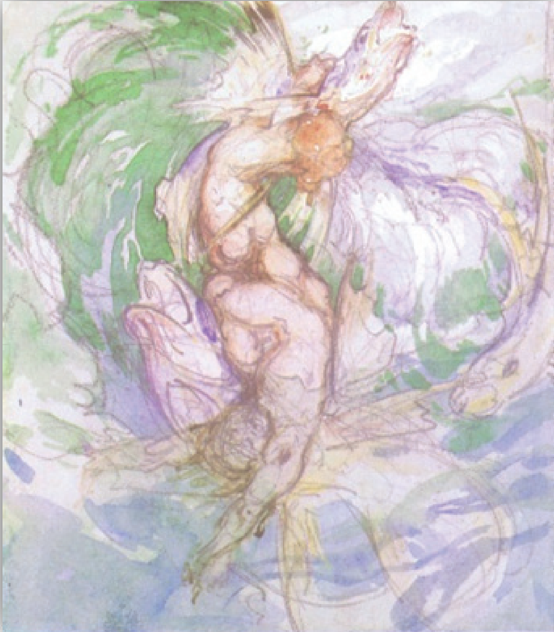
Ilustración 15. Lámina 27 . Néstor esencial.