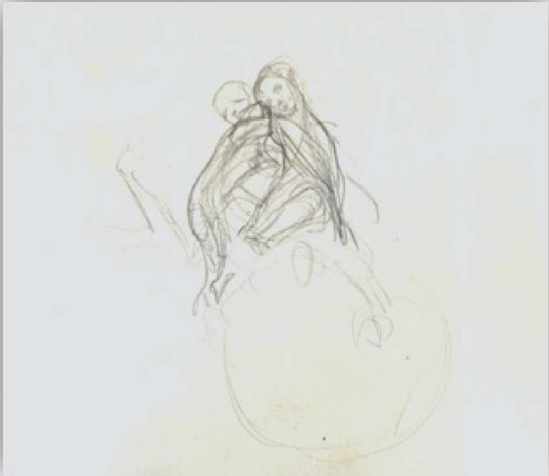
Ilustración 13. 767. Fondo Museo Néstor.