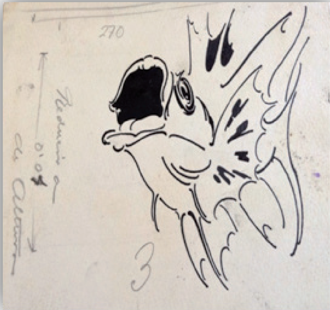
Ilustración 3. 270. Serie Fauna Fondos Museo Néstor.