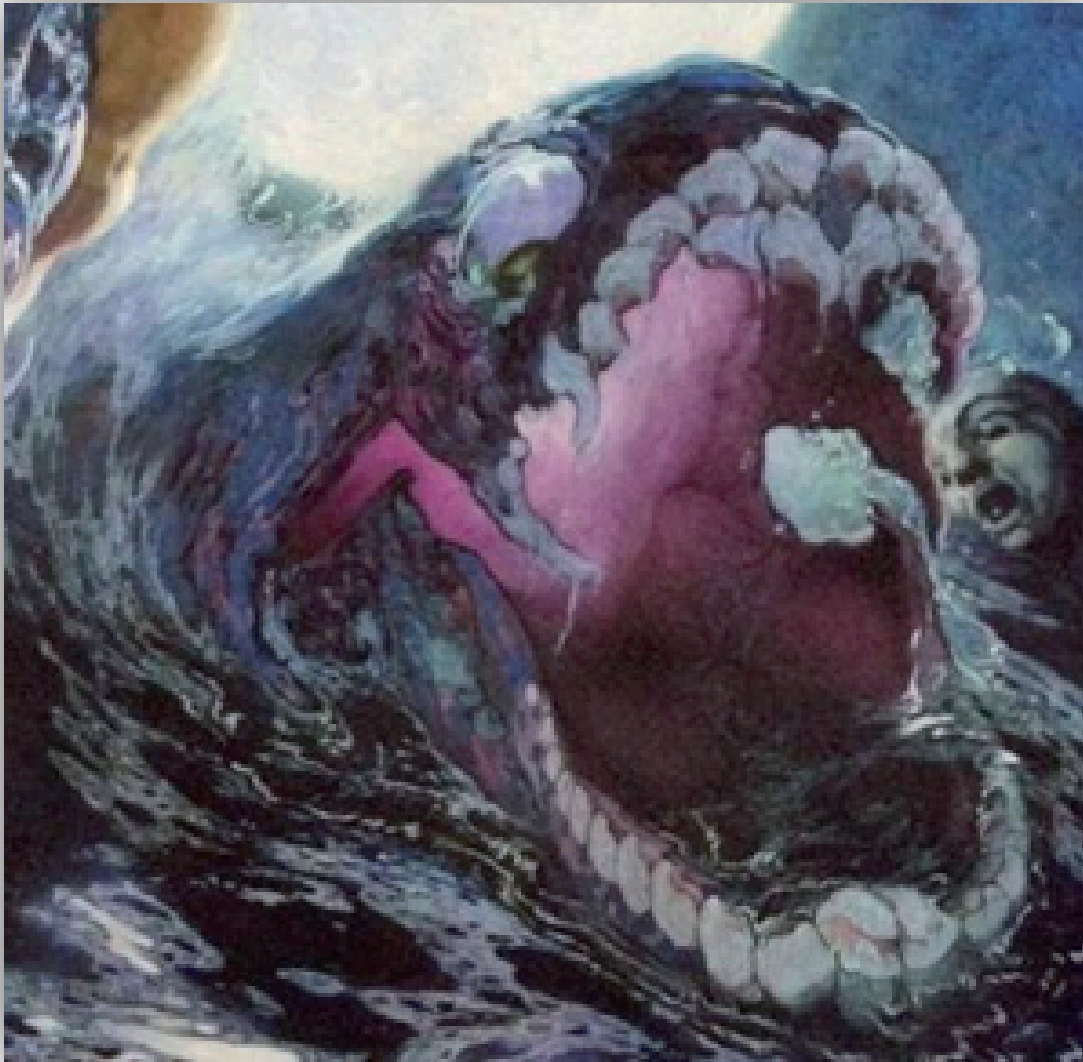
Ilustración 8. La Noche . Óleo sobre lienzo 126 x 126 cm. (1917-1918). Fondos Museo Néstor.

715. Serie de dibujos. 13,5 x 13,5 cm. Lápiz sobre papel. s/f. Composición en la que se aprecia unos peces saliendo de una gran ola. Al fondo la luna y en medio de la escena se aprecian unas caras con gesto de desesperación. Se relaciona de manera directa con la escena representada en el lienzo de La Noche para el Poema del Mar .