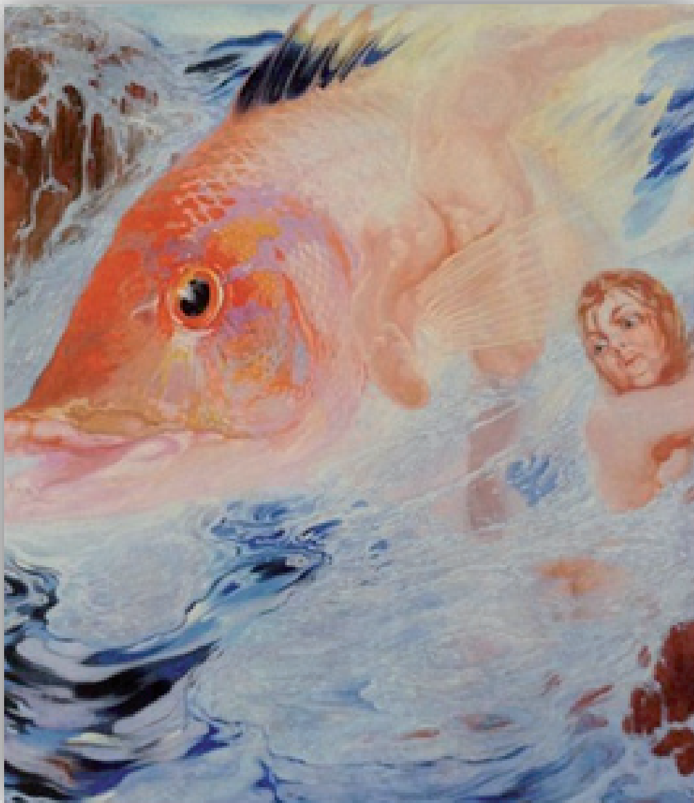
Ilustración 18. Pleamar . Óleo sobre lienzo 126 x 126 cm. (1921-1923). Fondos Museo Néstor.