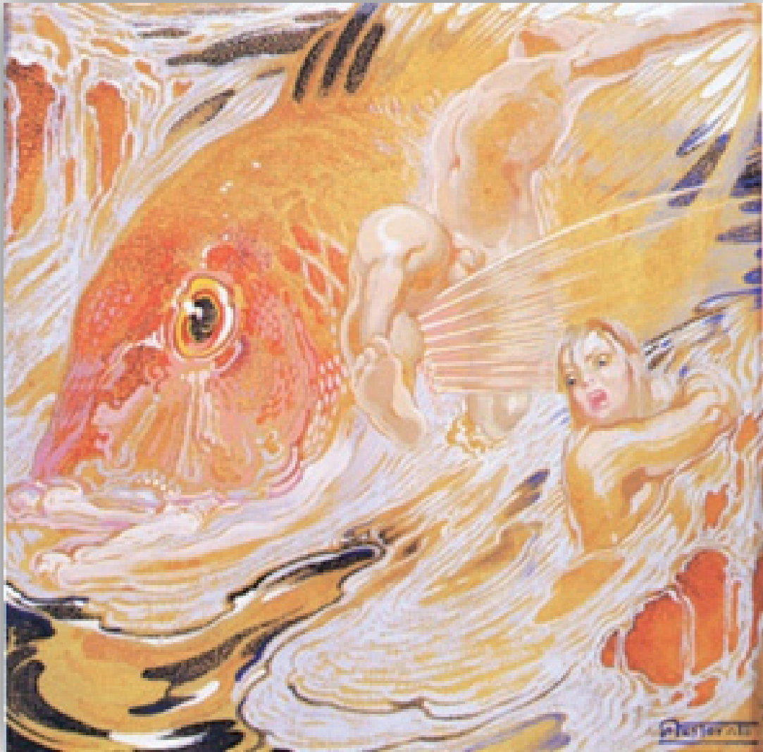
Ilustración 17. Lámina 29. Néstor Esencial.