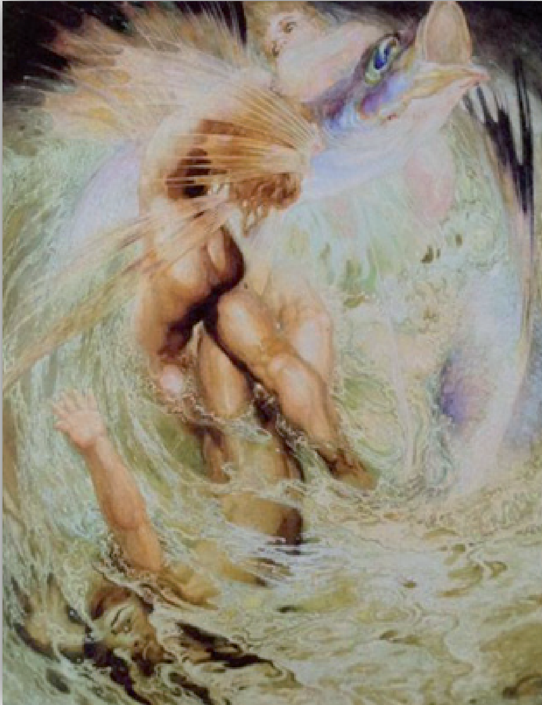
Ilustración 16. Mar en Borrasca. Óleo sobre lienzo 126 x 126 cm. (1921-1923).

(Lámina 29) Óleo/cartón. Fechado en 1917. Este boceto de Pleamar tiene la calidad de una obra final. Néstor cuida los detalles y utiliza el cartón como un color más, dejando parte sin pintar, pero encajadas perfectamente con el dibujo. La figura del extremo derecho es más dramática que la del lienzo definitivo y el agua de la parte inferior la pinta de negro. Estas son las dos principales diferencias que presenta con la obra final.