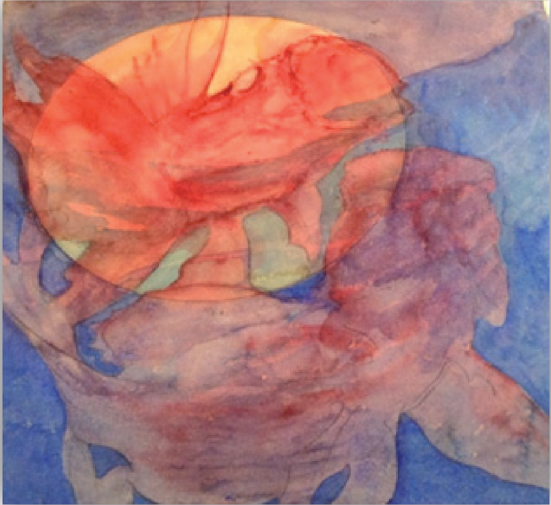
Ilustración 11. Sin enumerar .