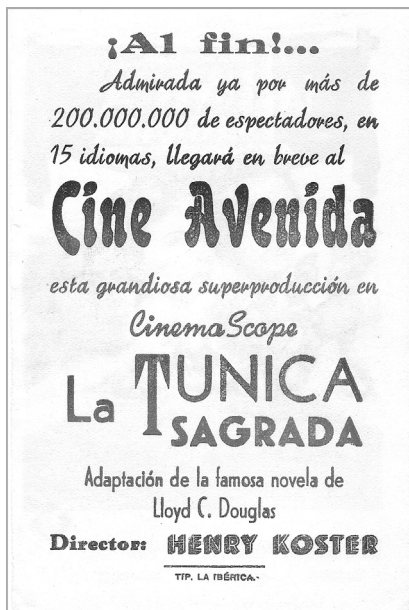
Cartel de La túnica sagrada , primera película en Cinemascope, estrenada en el Cine Avenida (anverso y reverso).

de San Juan 31 , el filmado en 1955 con motivo de la inauguración del «campo de aviación» o «aeródromo» de Buenavista, y el realizado en 1958 con el título de La isla verde que ensalzaba las bellezas naturales de la Caldera de Taburiente, pocos años después de su declaración como Parque Nacional.