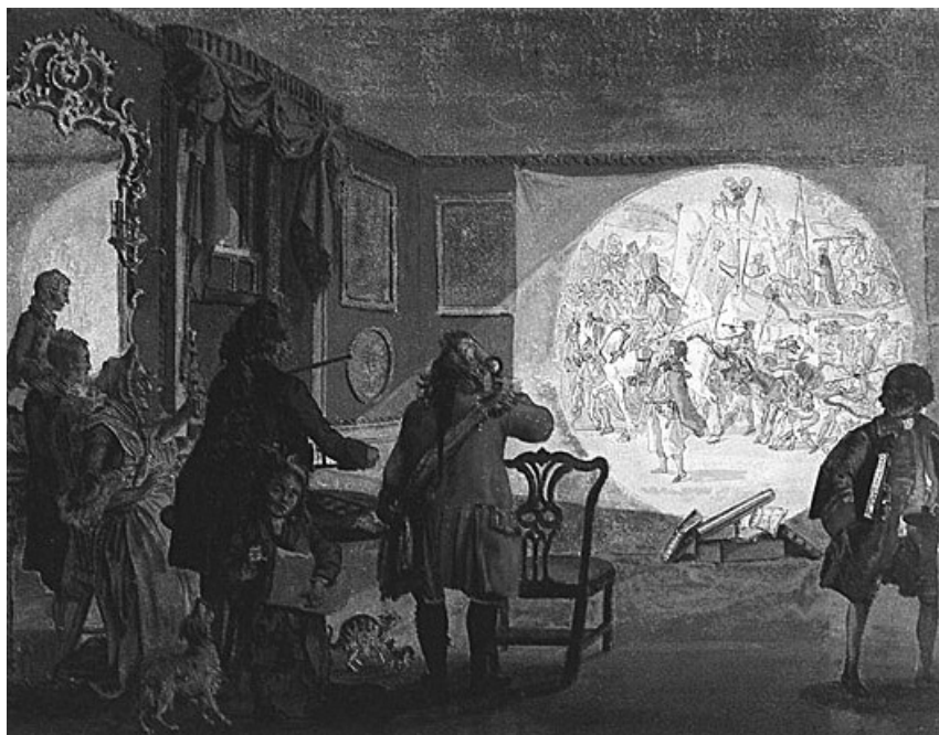
Paul Sandby. «La linterna mágica», acuarela (1760).

donde esta oculta una luz delante de un espejo cóncavo, enfrente del qual hai un cañon con dos lentes convexas, y passando por ellas la luz forma un circulo lucido en la pared blanca hacia donde se dirige. Introducense entre la luz y las lentes unas figuras mui pequeñas, pintadas en vidrio o talco con colores transparentes, y se ven representadas con toda perfeccion en la pared, sin perder la viveza de los colores, y en mucho mayor tamaño, aumentandose o disminuyendose lo que se quiere, con acortar o alargar el cañon 5 .