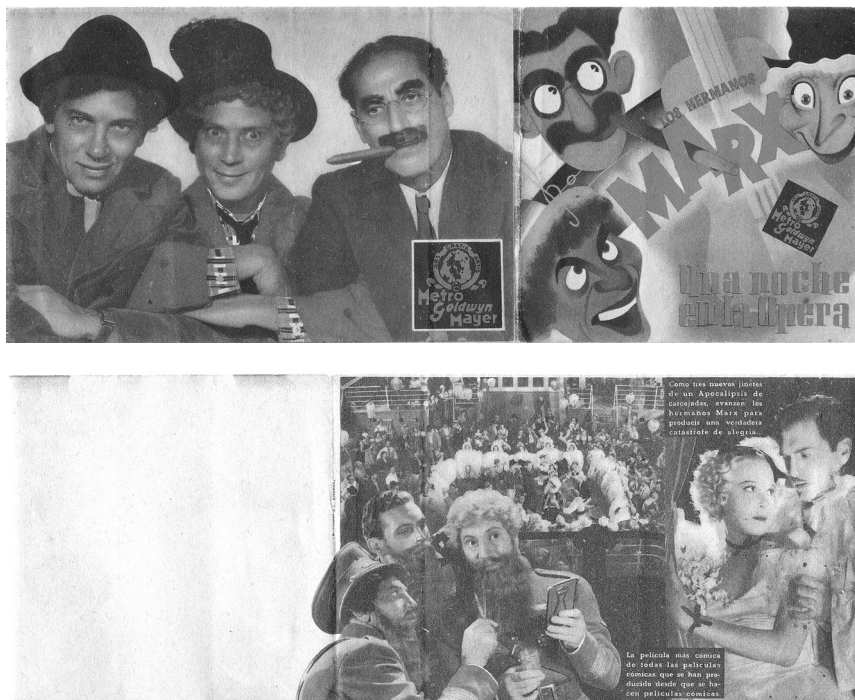
Hermanos Marx, actores de la Paramount (anverso y reverso).

turas. Todavía funcionaba el blanco y negro, pero comenzaban los primeros escauceos con el color ( Blancanieves y los siete enanitos de Walt Disney). También abrieron sus puertas el renovado Parque de Recreo, en abril de 1940, techado desde finales de 1948 29 , siendo su propietario don Manuel Fernández de las Casas; y el Imperial Cinema de Los Llanos de Aridane, en 1941.