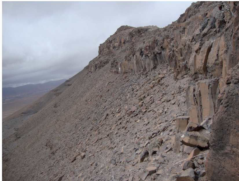
Foto n.º 2. Vista del Sector 2 y Sector 3 desde el Sector 4.