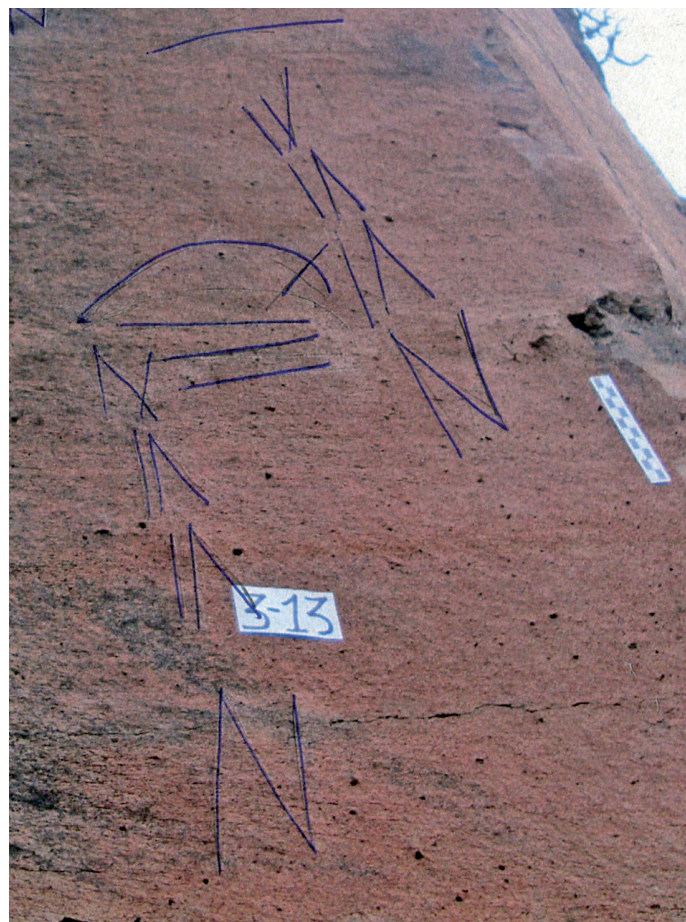
Foto n.º 5. Panel 13 del Sector 3. Contiene dos líneas líbico-bereber y una líbico-canaria.