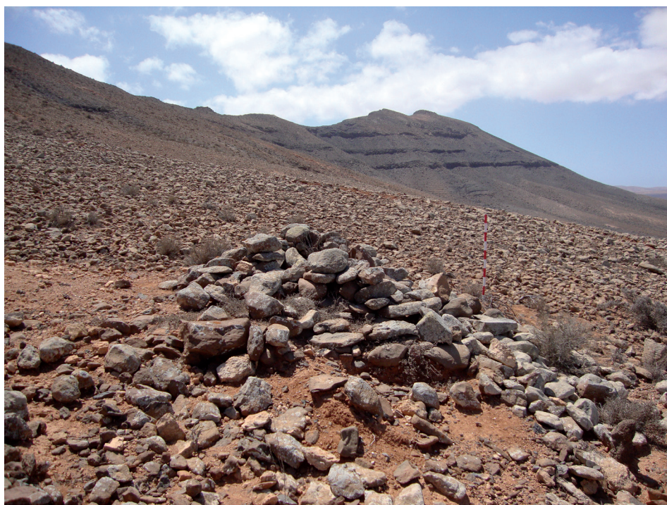
Foto n.º 1. Ladera sureste de Cuchillete Buenavista. Estructura arquitectónica número 1. Al fondo cima del Cuchillete. Foto: María Antonia Perera.