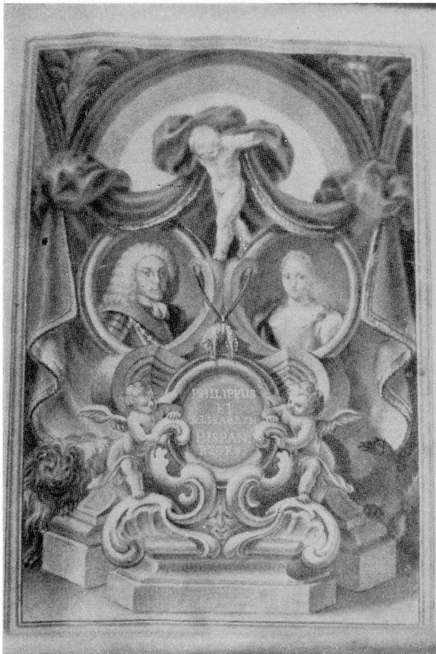
Miniaturas con las efigies de los monarcas Felipe V e Isabel de Farnesio, que ilustran el Real Despacho de concesión de la dignidad nobiliaria.