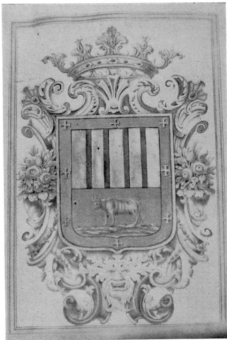
Escudo de armas del Marqués del Toro, que adorna el Real Despacho de concesión de dicho título, otorgado por Felipe V en Sevilla el 26 de septiembre de 1732.