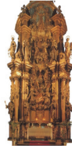
Figura 11: Retablo mayor barroco de la Catedral.