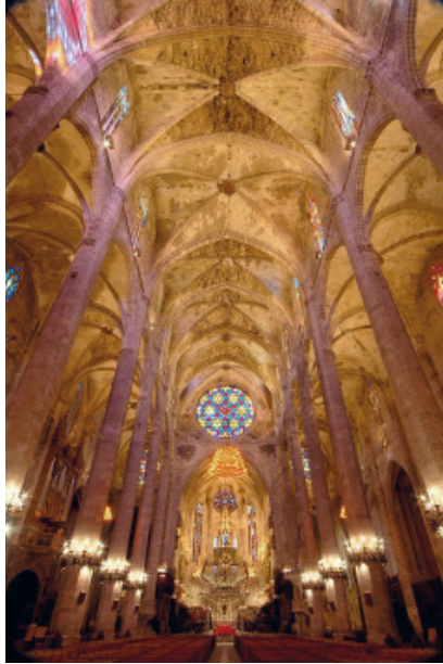
Figura 4: Fotografía general del interior de la Seo mallorquina.