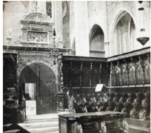
Figura 8: Fotografía de Emilio Sagristá antes de la reforma de Gaudí en que podemos ver el interior del coro (ACM).