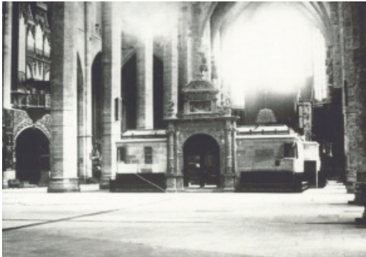
Figura 7: Fotografía de Emilio Sagristá antes de la reforma de Gaudí en que podemos ver el exterior del coro desde los pies (ACM).

El coro catedralicio es otro de los elementos más comentados del interior, que entonces aún se encontraba en medio de la nave central, pues con la reforma de Gaudí se trasladó a la capilla Real. Su realización se desarrolló durante el primer tercio del siglo XVI y contó con la intervención de Antoine Dubois, Philippe Fillau y Juan de Salas. El conjunto coral constaba de dos partes esenciales: una ejecutada en madera, que sería la sillería; y la otra en piedra, que son los dos púlpitos y el portal de acceso 25 ( Figuras 7 y 8 ).