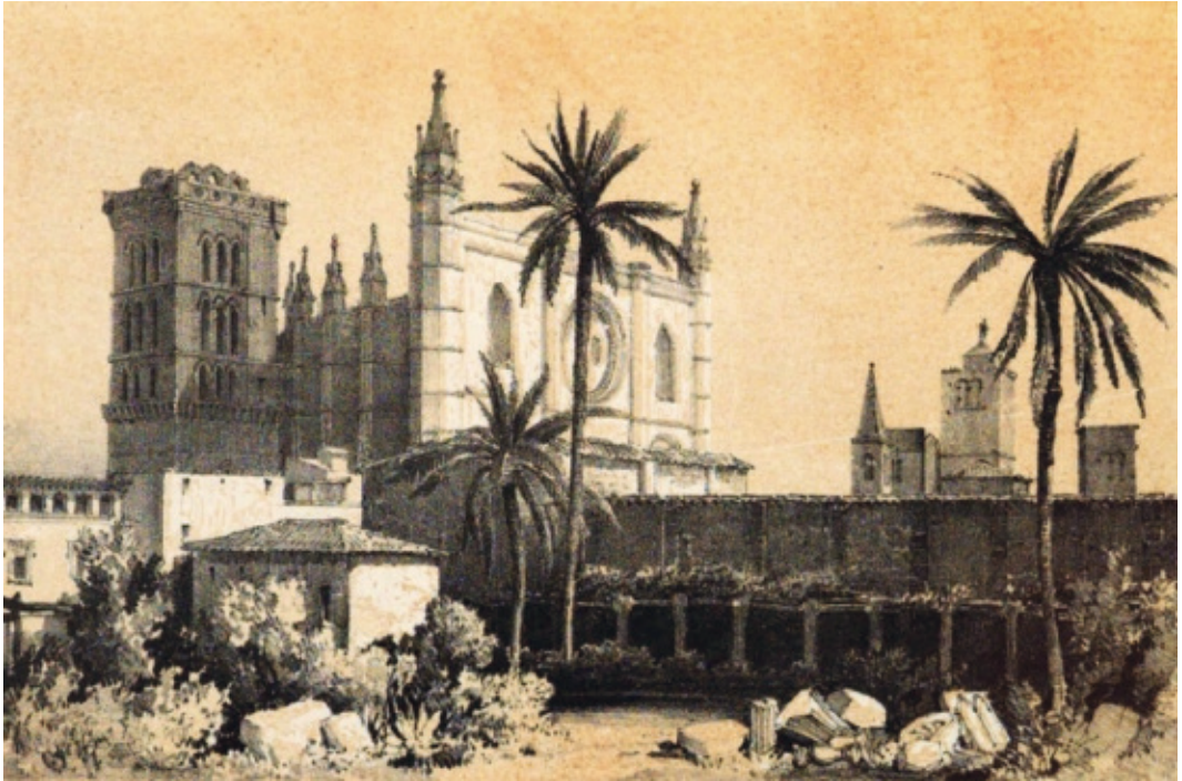
Figura 15: Grabado de la obra de Laurens, con las ruinas del Convento de Santo Domingo en primer plano y la Catedral al fondo.

podemos ver el Portal del Mirador, elemento que tanto le fascinó (lámina 23 del libro) ( Figura 1 ). Esta imagen se complementa con otro grabado en que el autor representó varios de los ángeles músicos presentes en dicho portal (lámina 26 del libro). En la quinta ilustración vinculada a la Catedral se puede contemplar una vista de su interior, con el sepulcro del rey Jaime II y el recinto coral (lámina 24 del libro) ( Figura 5 ). La última litografía se corresponde con un dibujo general y varios detalles del retablo mayor gótico (lámina 25 del libro).