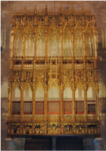
Figura 10: Retablo mayor gótico, ubicado sobre el Portal del Mirador.