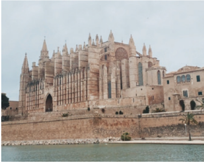
Figura 3: Fotografía del exterior de la Catedral.

Por medio de este breve pasaje queda patente que Medel también se encontraba totalmente influido por los principios del Romanticismo, pues el portal no le mereció una opinión favorable, seguramente por no ajustarse a los cánones del arte gótico.