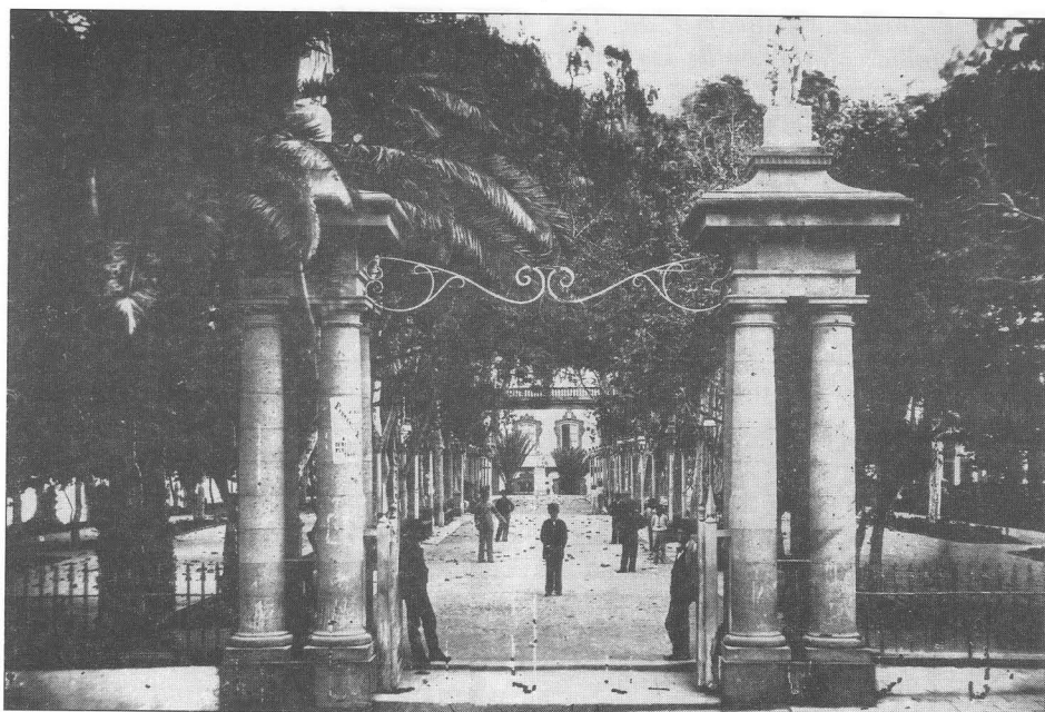
Así era La Alameda

motivo del Centenario de su fundación. Las Palmas de Gran Canaria: Imprenta Minerva, 1948. 30 páginas.