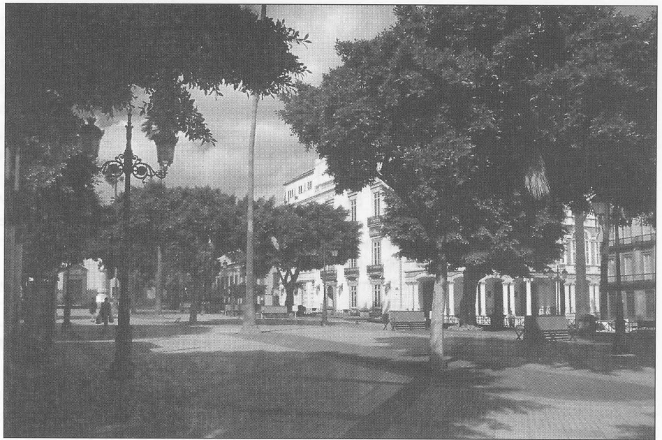
El Gabinete Literario

Publicado como folletón del periódico del 1 de marzo al 13 de julio de 1957 y del 7 de octubre de 1958 a 31 de marzo de 1959, es obra inconclusa, que llega sólo hasta 1881. Miguel Santiago indica en su momento que es un “documentado estudio de la vida de la Ciudad de Las Palmas de Gran Canaria, principalmente de 1800 a 1880, con motivo de destacar la fundación del Centro de Instrucción y Recreo a que se refiere. Es aportación preciosa