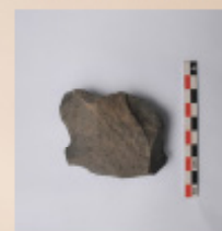
Raedera (SE Peña Las Cucharas, UE 1Lev4)