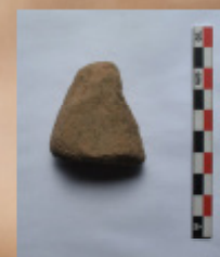
Fragmento de toba desgastados en todos sus laterales (Sondeo 9)