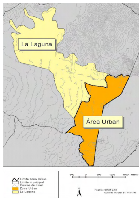
Figura II. Detalle del área URBAN-La Laguna.

El espacio URBAN ocupa unas 475 hectáreas, inscritas en la mitad de la conurbación Santa Cruz-La Laguna e incluye los barrios de La Cuesta y Taco, así como los núcleos de Los Andenes y Las Chumberas, localizados en el sector meridional del término. En 1996 residían en ese ámbito 29.000 personas, casi la cuarta parte de la población del municipio lagunero, con densidades cercanas a los 6.000 habitantes por Km 2 .