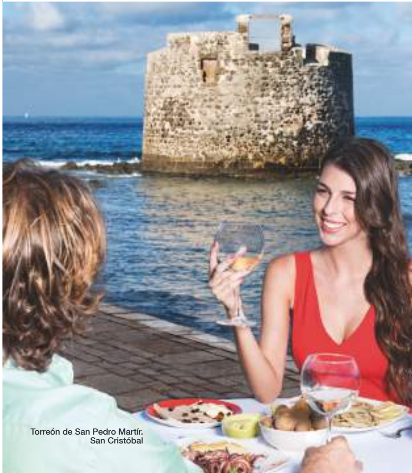
Torreón de San Pedro Martir. San Cristóbal