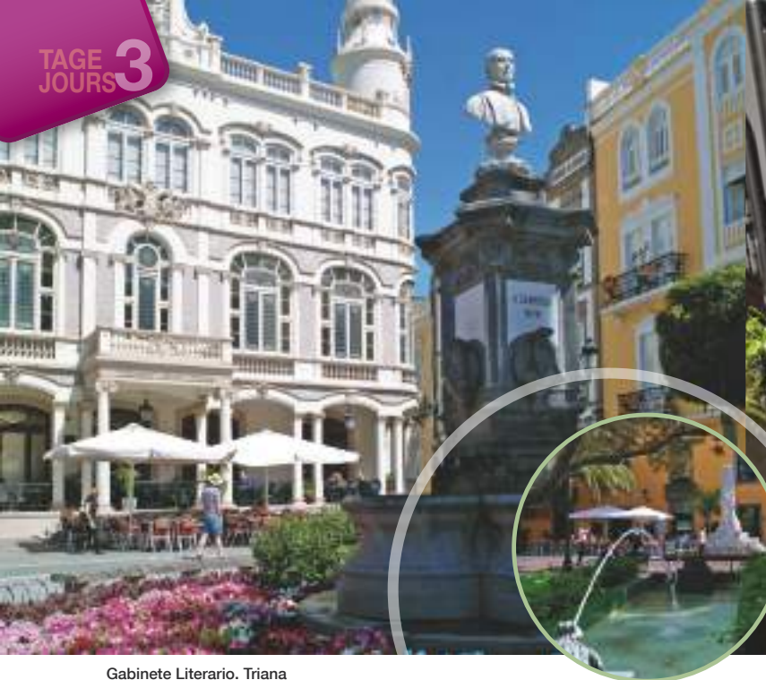
Gabinete Literario. Triana