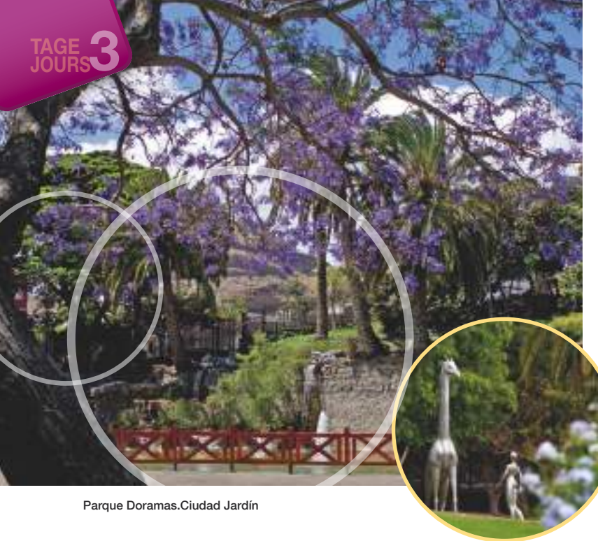
Parque Doramas.Ciudad Jardín