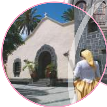
Pueblo Canario. Ciudad Jardín