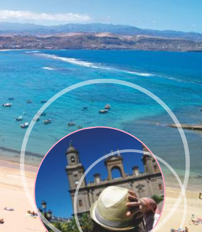
Catedral de Santa Ana. Vegueta