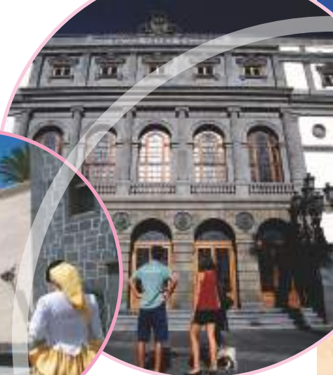
Teatro Pérez Galdós