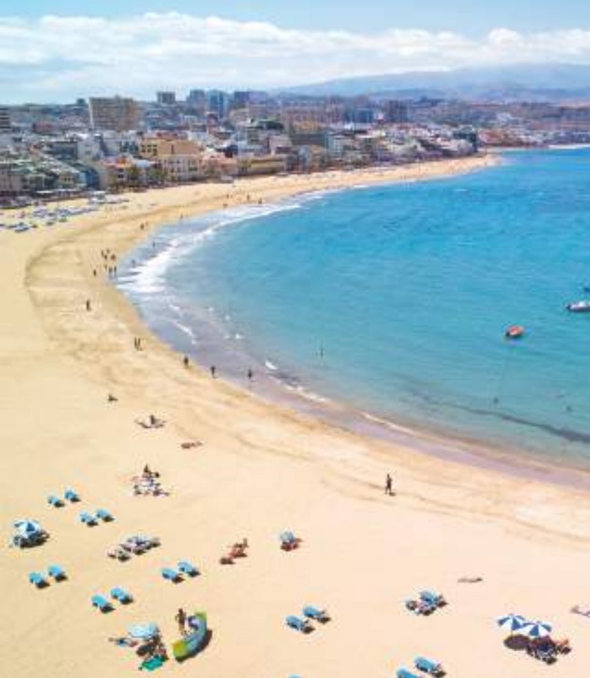
Playa de Las Canteras