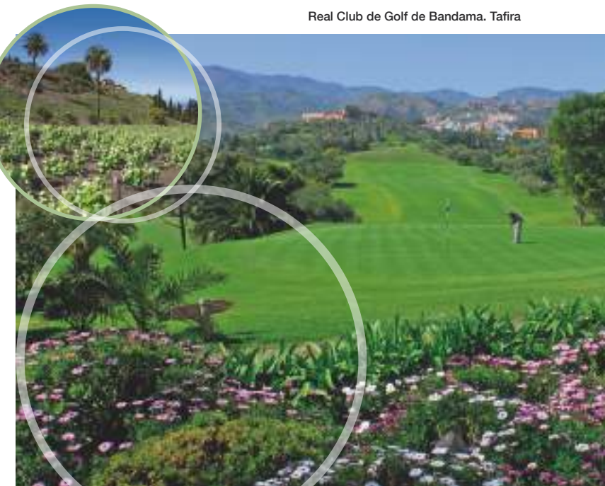
Real Club de Golf de Bandama. Tafira

Dans les environs de la ville il y a des endroits surprenants comme le cratère et le pic de Bandama, un volcan explosif qui a pu être le dernier phénomène volcanique qui a eu lieu à Gran Canaria. Au pied de la montagne s'étend le Real Club de Golf de Bandama- le plus ancien d'Espagne- et à peu de kilomètres se trouve l'ancien village troglodyte de La Atalaya, où les habitants vivaient dans des grottes et leur moyen de subsistance étaient la fabrication de faïence et des pots en argile à la manière antérieure à la conquête de l'île. Pour revenir à la capitale il est obligatoire de s'arrêter au Jardin Botanique Viera y Clavijo, le centre botanique et scientifique de la Région Macaronésienne le plus important en son genre.