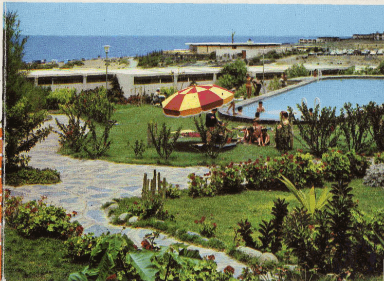
Piscina de Los Caracoles

In this unforgettable site, you will love to spend restful quiet days and carry away with you lasting memories from this wonderful part of the Canarian Islands.