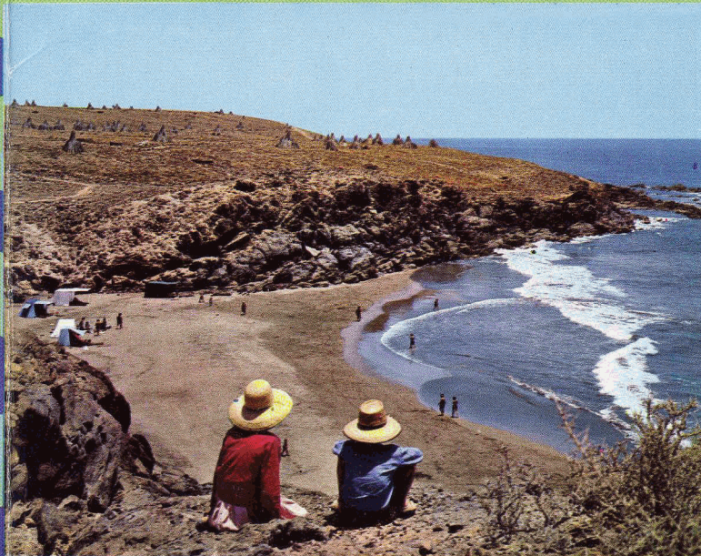
Playa de La Cometa