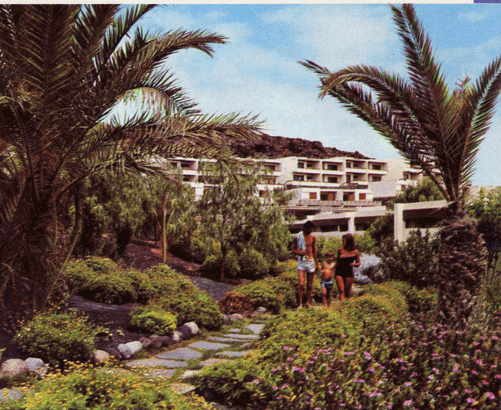
Jardín de Los Caracoles