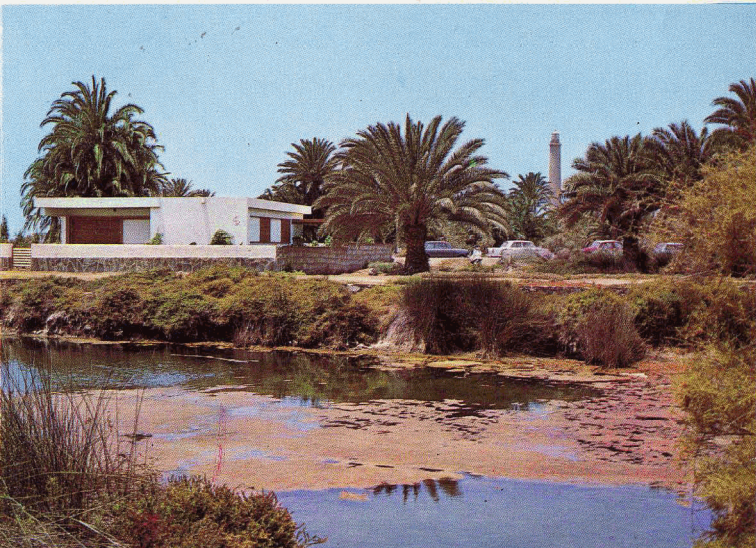
Maspalomas : villas particulares