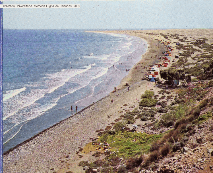
Playa del Inglés