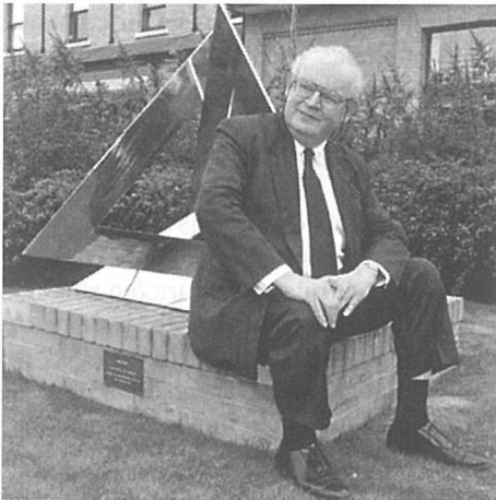
B. Mandelbrot a las puertas del Instituto Newton de la Universidad de Cambridge

Los modelos matemáticos en climatología no pretenden el pronóstico exacto sino diagnósticos cualitativos. La escala temporal es mucho mayor. Una de las aportaciones más singulares y pioneras se debe al astrónomo yugoslavo Milutin Milankovitch (1879-1958): el primero en completar una teoría climática de las glaciaciones del Pleistoceno, calculando los elementos orbitales y los subsiguientes cambios en la insolación y en el clima.