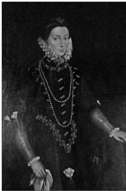
Beatriz de Bobadilla.